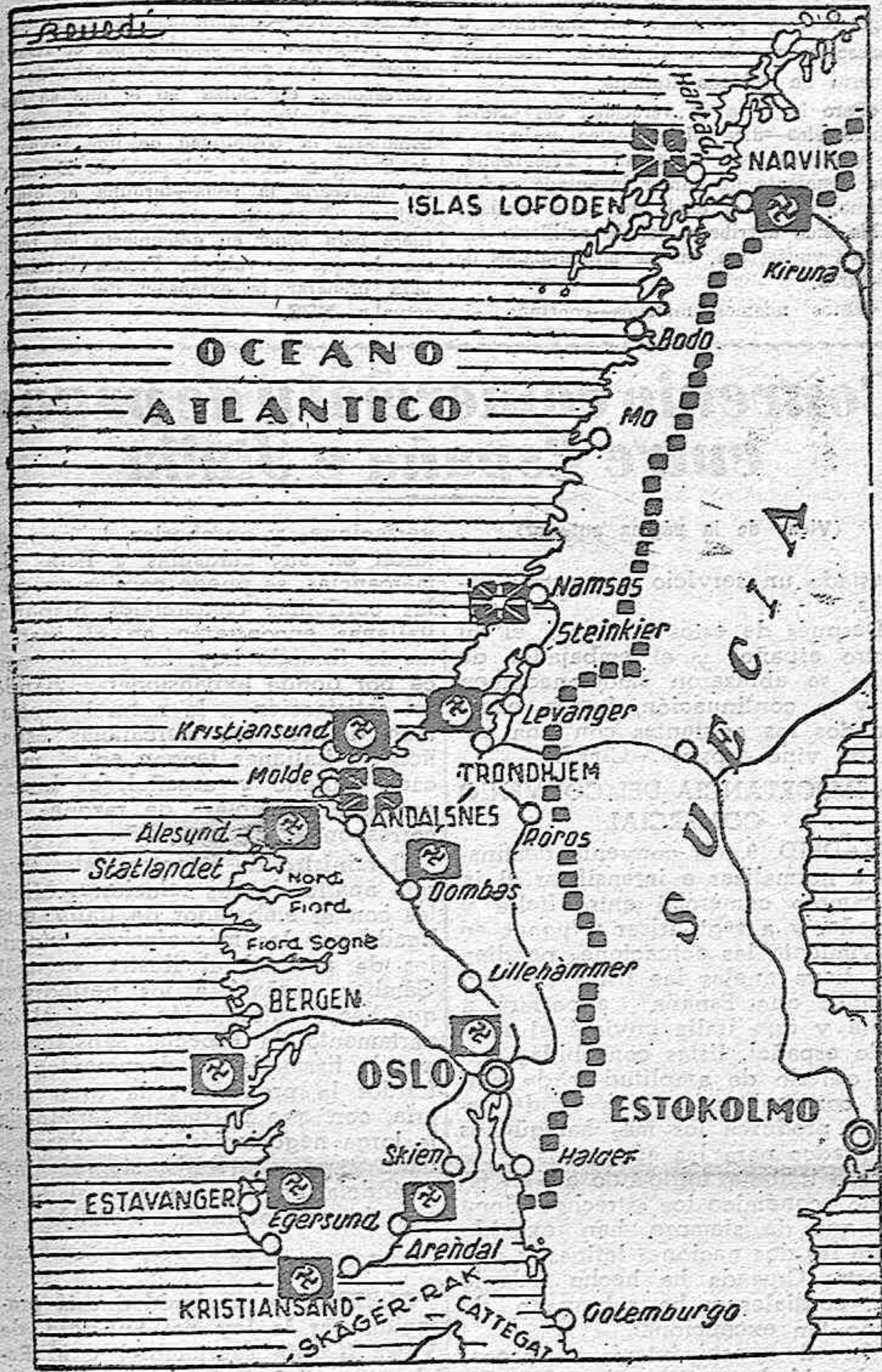
Para que nuestros lectores puedan darse cuenta del desarrollo de la guerra en Noruega, insertamos el presente gráfico, donde, con las banderas respectivas de los beligerantes, quedan reflejadas las posiciones de los mismos en el país nórdico, si bien la existencia de la bandera británica en Andalsnes y Namsos, expresa los lugares donde las tropas aliadas reembarcaron sus tropas ante la presión de las fuerzas alemanas. Únicamente conservan las posiciones de los alrededores de Narvik desde donde apoyan su ataque a la ciudad.