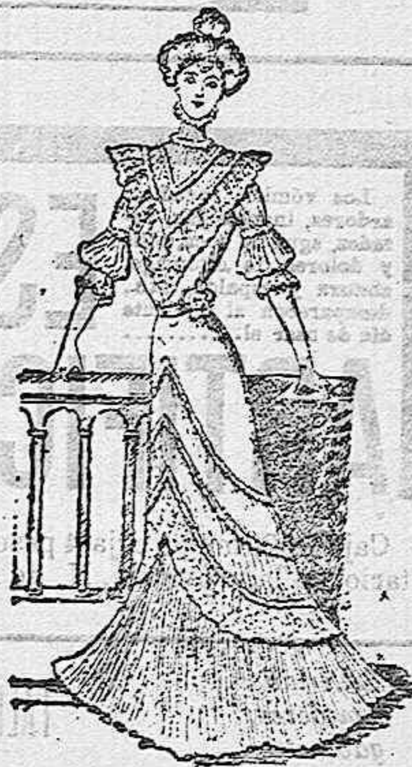
Modelo de traje para recibir visitas

Cuerpo de seda, color claro, totalmente cubierto en el delantero con tres anchísimas blondas. Cinturón estrecho de la propia tela. Sobrefalda, también de lo mismo, con tres órdenes de blondas, formando ángulos cuyo vértice está en el delantero. Falda ancha color de lila.