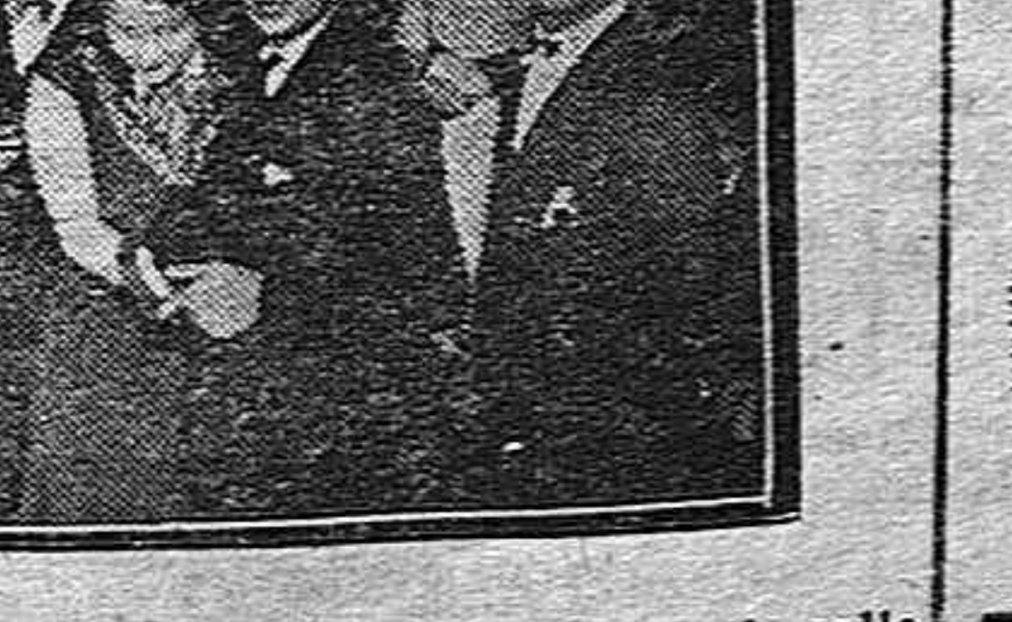
El elegante Salón de té "Hollywood-Salón", (situado en la calle de Maura, junto al Hotel Iberia) durante la fiesta de inauguración

La Orquesta Hollywood interpretó un escogido programa de bailables, interpretando maravillosamente los fox-americanos y los tangos argentinos. La inauguración del "Hollywood-Salón" ha causado granísima impresión entre el elemento joven de nuestra buena sociedad que echaba de menos en nuestra capital un lugar de reunión tan elegante y distinguido como el que se acaba de inaugurar y que tan magnífica acogida ha tenido. Felicitamos a la Junta Directiva por el éxito alcanzado ayer y deseamos que se repitan en lo sucesivo.