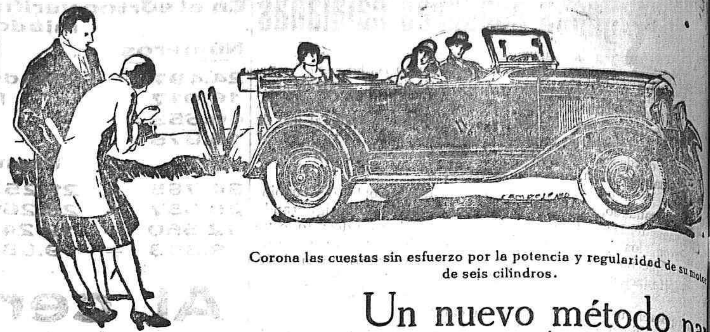
Corona las cuestas sin esfuerzo por la potencia y regularidad de su motor de seis cilindros.

Paseo de Pereda, 2 Hijos de Basterrechea Teléfono. 3441 Dirección Telegráfica «Basterrechea»