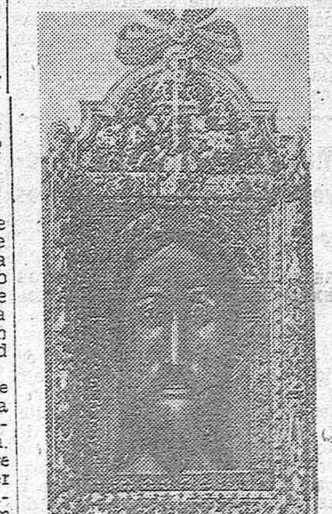
La Santa Faz, que se venera en la Catedral de Jaén, recuperada en París, a donde fué llevado por los rojos, y que ayer, viernes, salió de Francia con destino a España.