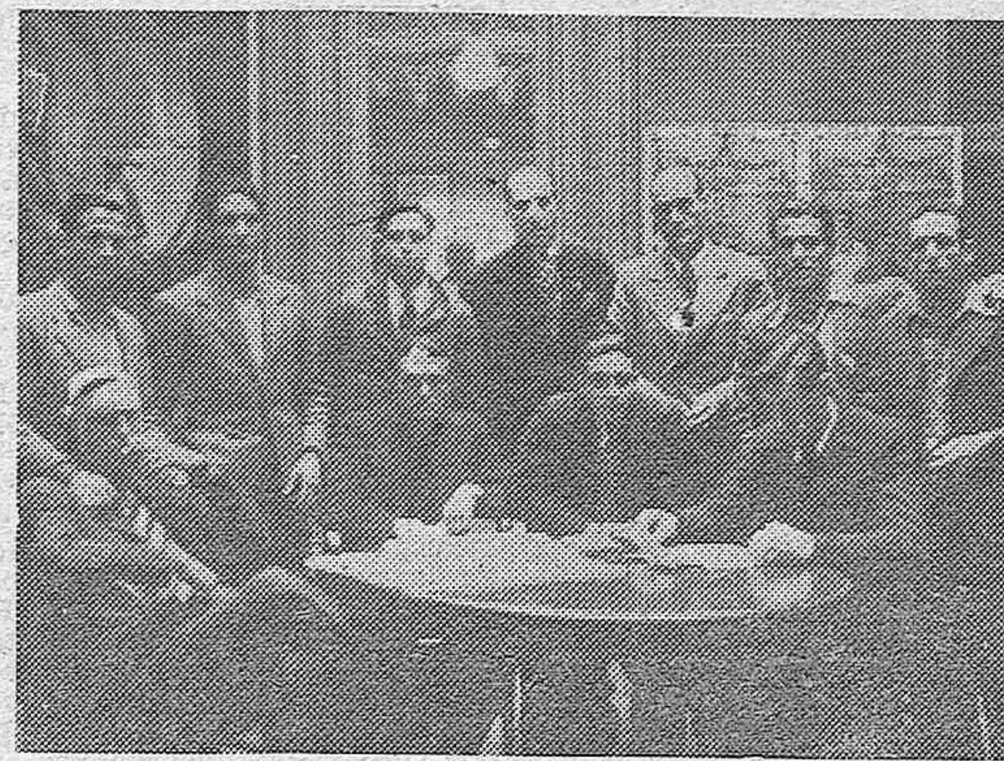
Parte del equipo del Español —los más fuertemente lesionados se encontraban en cama— reunidos en una habitación de un hotel madrileño, pocas horas después de su accidente de automóvil ocurrido en Talavera.