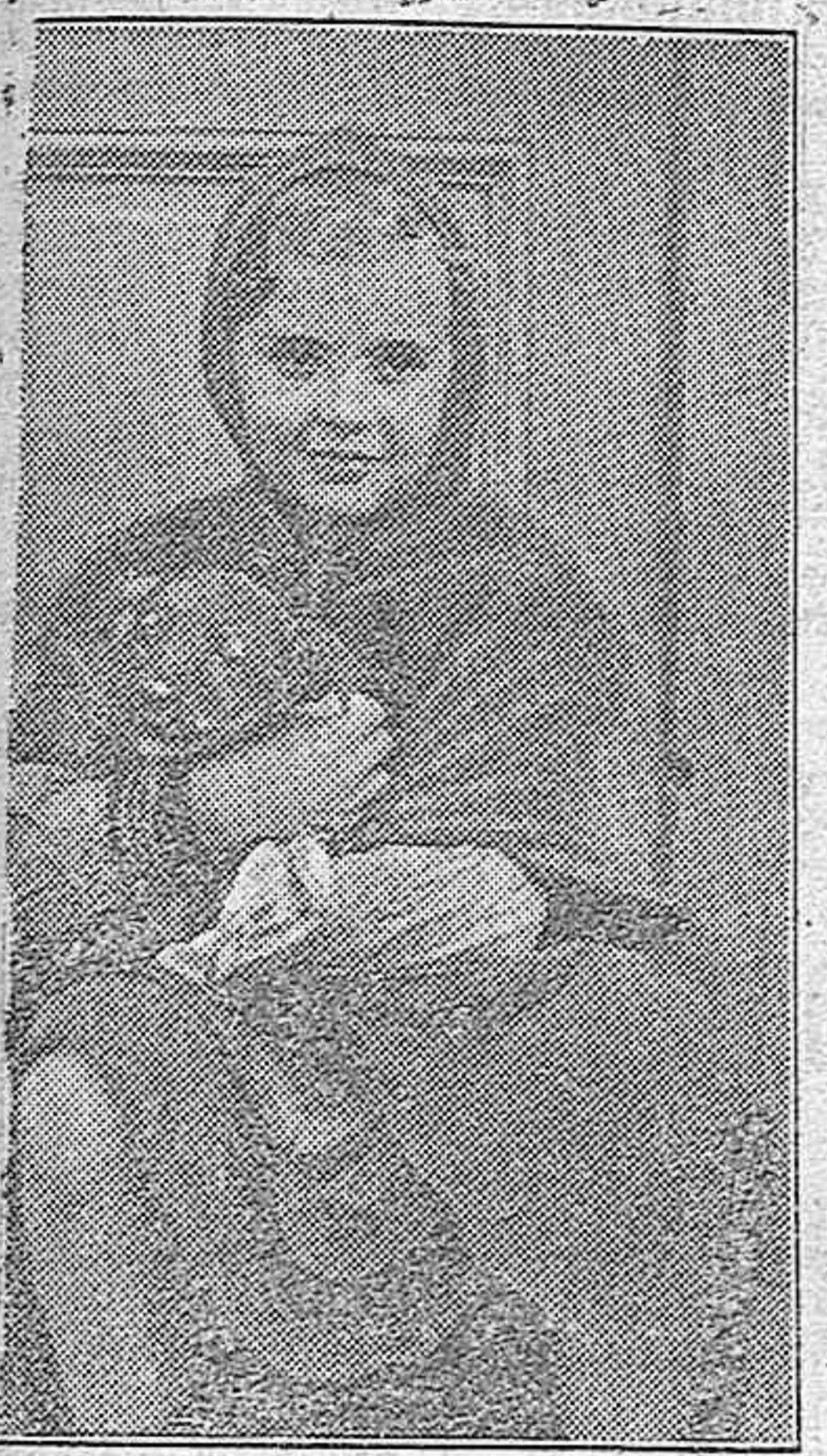
Trand Stark, la pequeña estrella del cinema alemán, que triunfa en la gran superproducción "Mutterliebe"