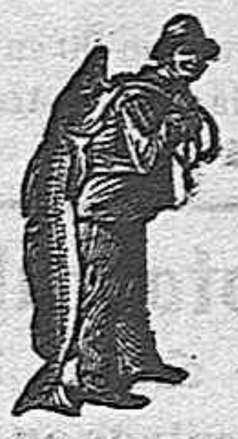
Obténase siempre la Emulsión con esta marca «El Pescador» marca del procedimiento Scott.

Ninguna otra emulsión en el mundo podía curar y fortalecer los pulmones del sargento, como hizo la Emulsión SCOTT, porque ninguna otra está compuesta de los mismos materiales puros y vigorizantes (haciendo caso omiso del coste) por el procedimiento único de SCOTT, que asegura la perfecta asimilación. Sin «el pescador con el pescado» en el envoltorio, la emulsión