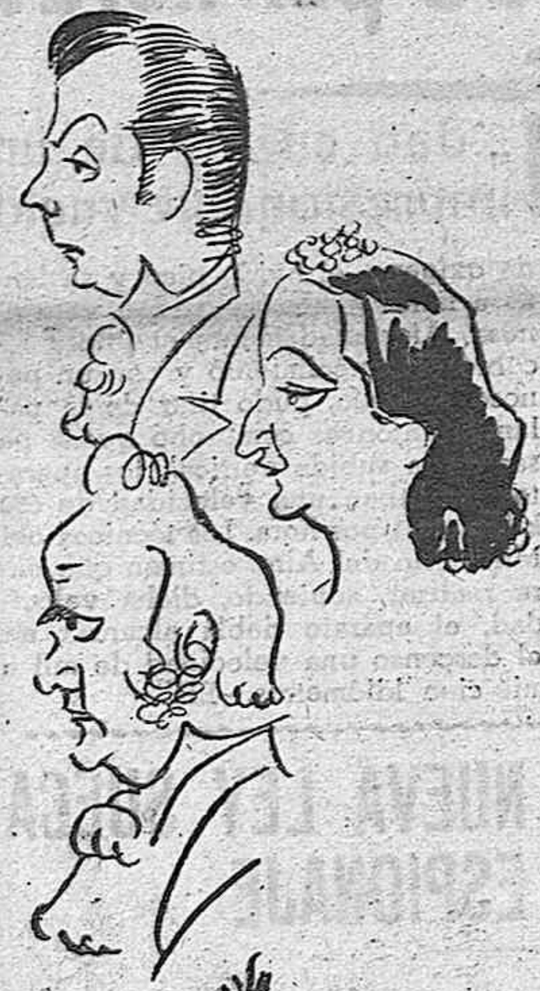
El tenor Alcayde, Mercedes Caprís y Stracciari, vistos por USA