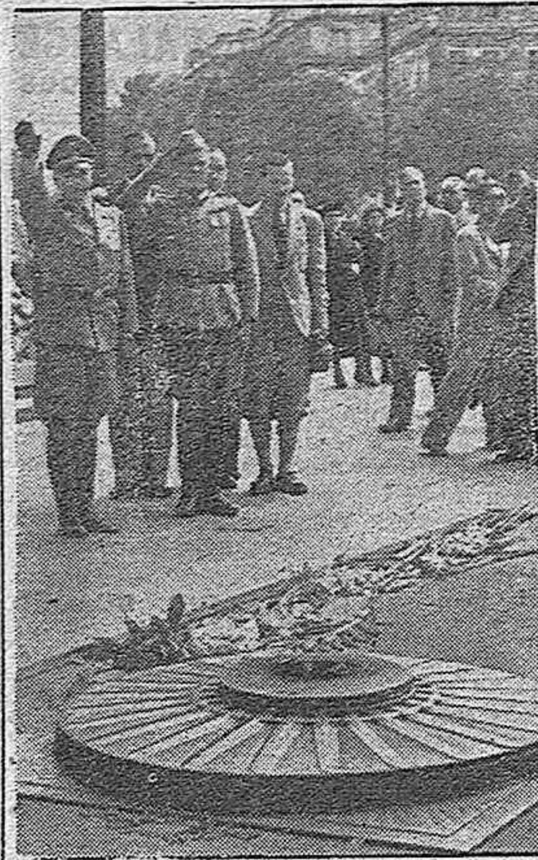
El jefe de Prensa del Reich, Dr. Dietrich, en su reciente visita a la tumba del Soldado Desconocido, en París, acompañado de corresponsales alemanes y extranjeros.

EN LA TUMBA DEL SOLDADO DESCONOCIDO, EN PARIS