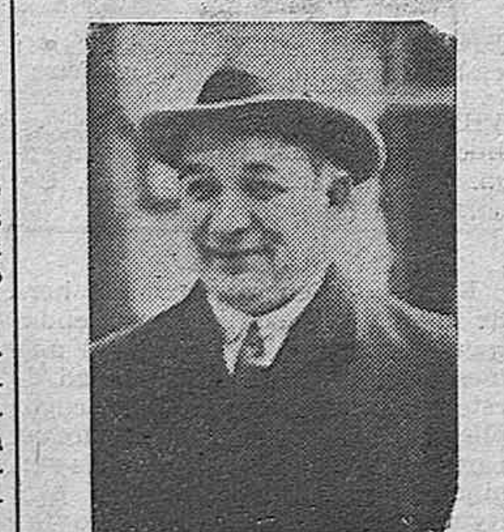
El nuevo presidente del Gobierno sueco, señor Hanson.

La Dirección general del Tesoro ha acordado que el día 20 del actual se abra el pago de la mensualidad corriente de los haberes activo y pasivo que se perciben en Madrid, en las provincias de España y Tesorería de la Dirección general de la Deuda y Clases Pasivas.