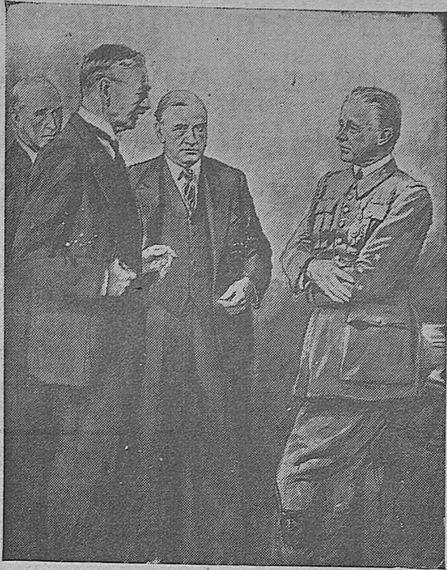
CHAMBERLAIN, DALADIER Y GAMELIN. Los tres miembros más destacados del Consejo Supremo francés e inglés, en una de las reuniones del alto organismo de guerra interaliado.

Después del discurso, la delegada nacional camarada Mercedes Sanz Bachiller, se reunió con los delegados provinciales.