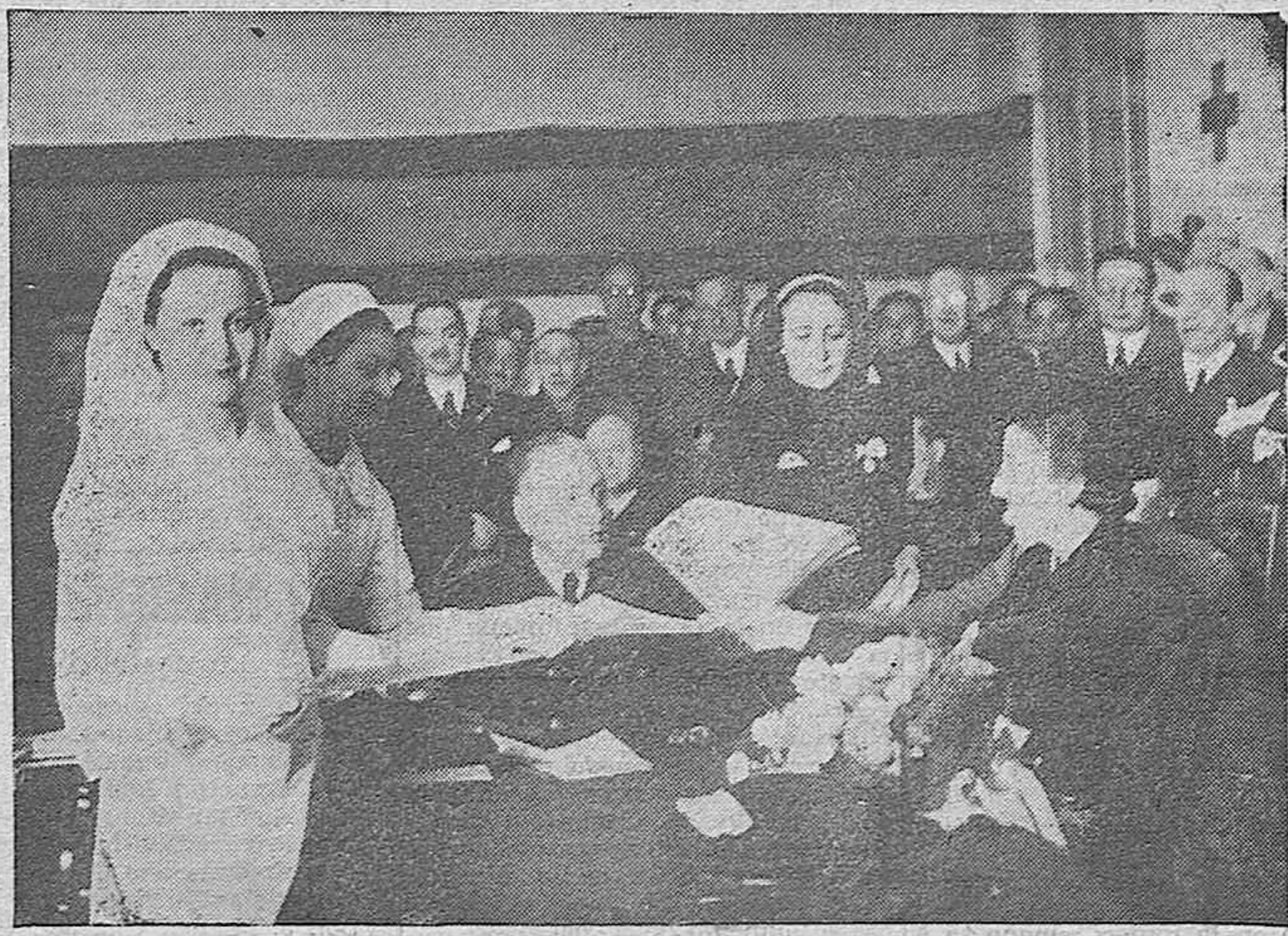
MADRID.—La esposa del jefe del Estado, doña Carmen Polo de Franco, entrega sus nombramientos a las nuevas enfermeras de la Cruz Roja y las recompensa a las mismas

Las tropas finlandesas esperan refuerzos para rechazar al enemigo hasta el mar