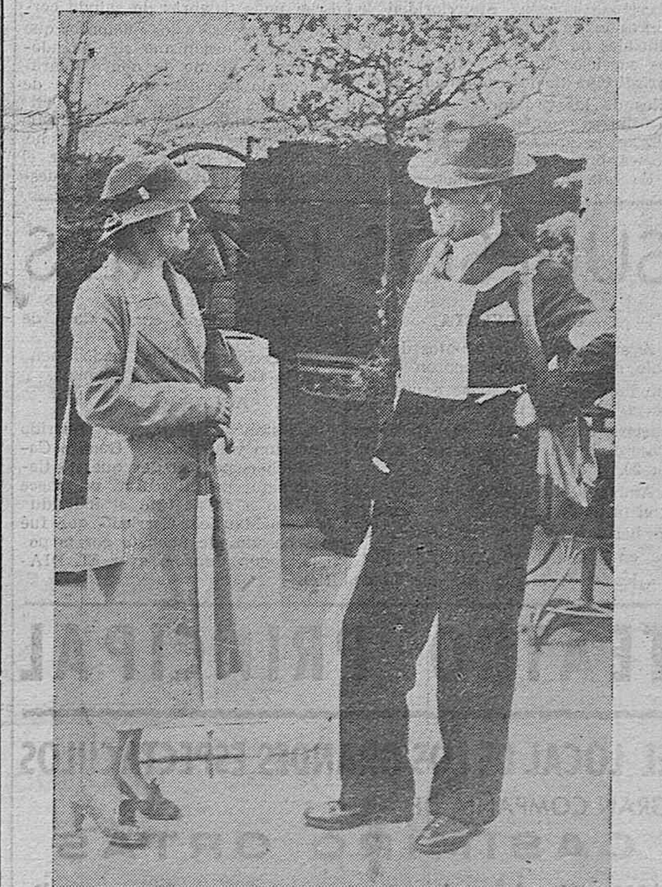
LONDRES.—Para hacerse visibles los peatones en el oscurecimiento total que imponen las precauciones contra los posibles ataques aéreos, los industriales ingleses han lanzado al mercado como se ve en la foto, estuches de máscara antigás y fundas de paraguas, de un tejido blanco luminoso, así como petos, brazaletes blancos para los caballeros.

Administrarán las santas aguas bautismales, el Rvdo. P. Agustín