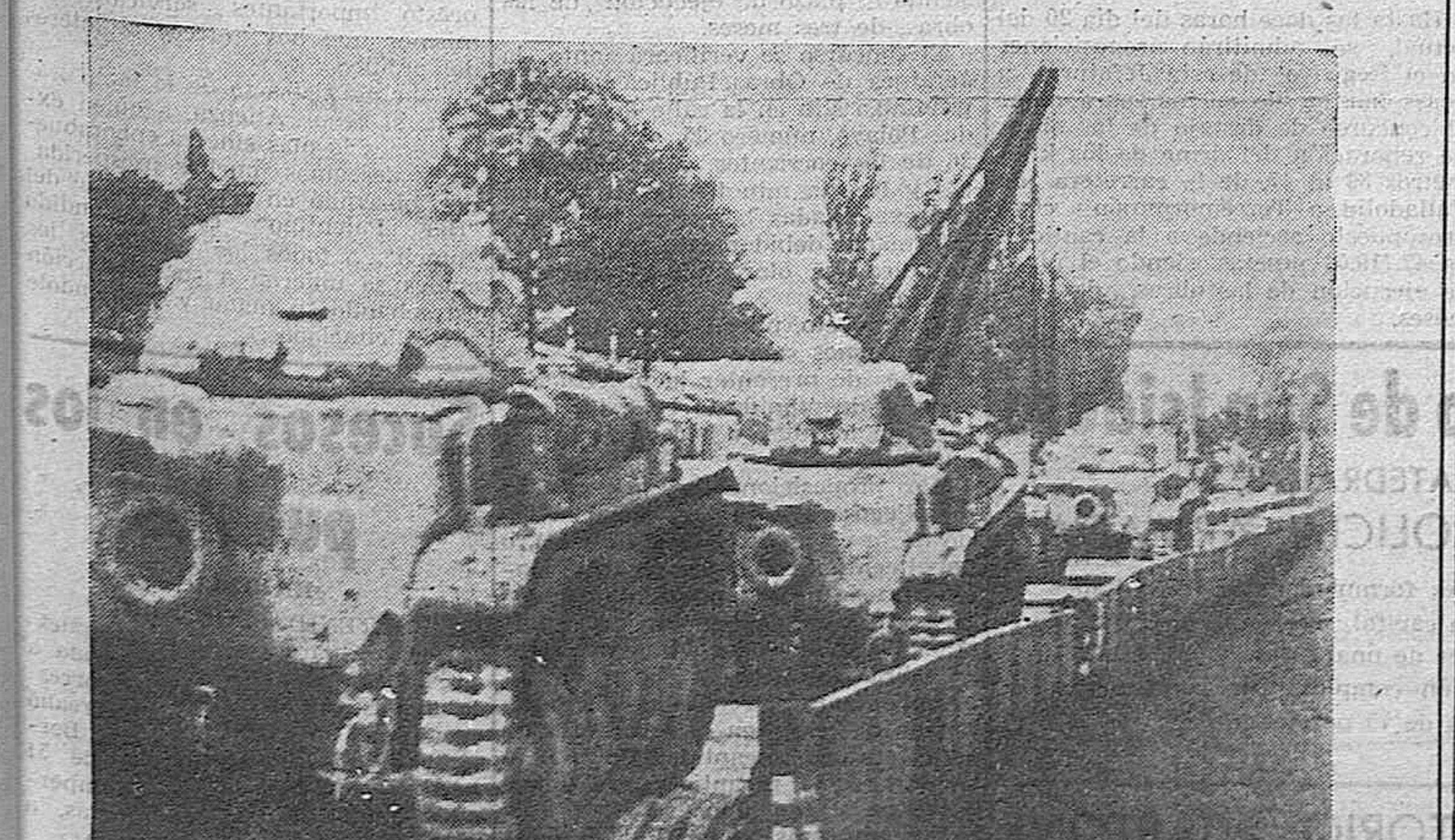
Embarque de tanques franceses en vagones plataformas

Londres.—El Gobierno de la India, ha aceptado la invitación del Gobierno británico, a fin de enviar un representante que participará en las conversaciones entre los Ministros de los Dominios en Londres. El representante indio será Sir Muhammad Zafrullah Khan. FELICITACIONES A OLIVEIRA SALAZAR Lisboa, 11 (4,30 t).—El presidente del Consejo de Ministros, Oliveira Salazar, ha recibido numerosos telegramas de felicitación por el discurso pacifista pronunciado ayer ante la Asamblea nacional portuguesa.