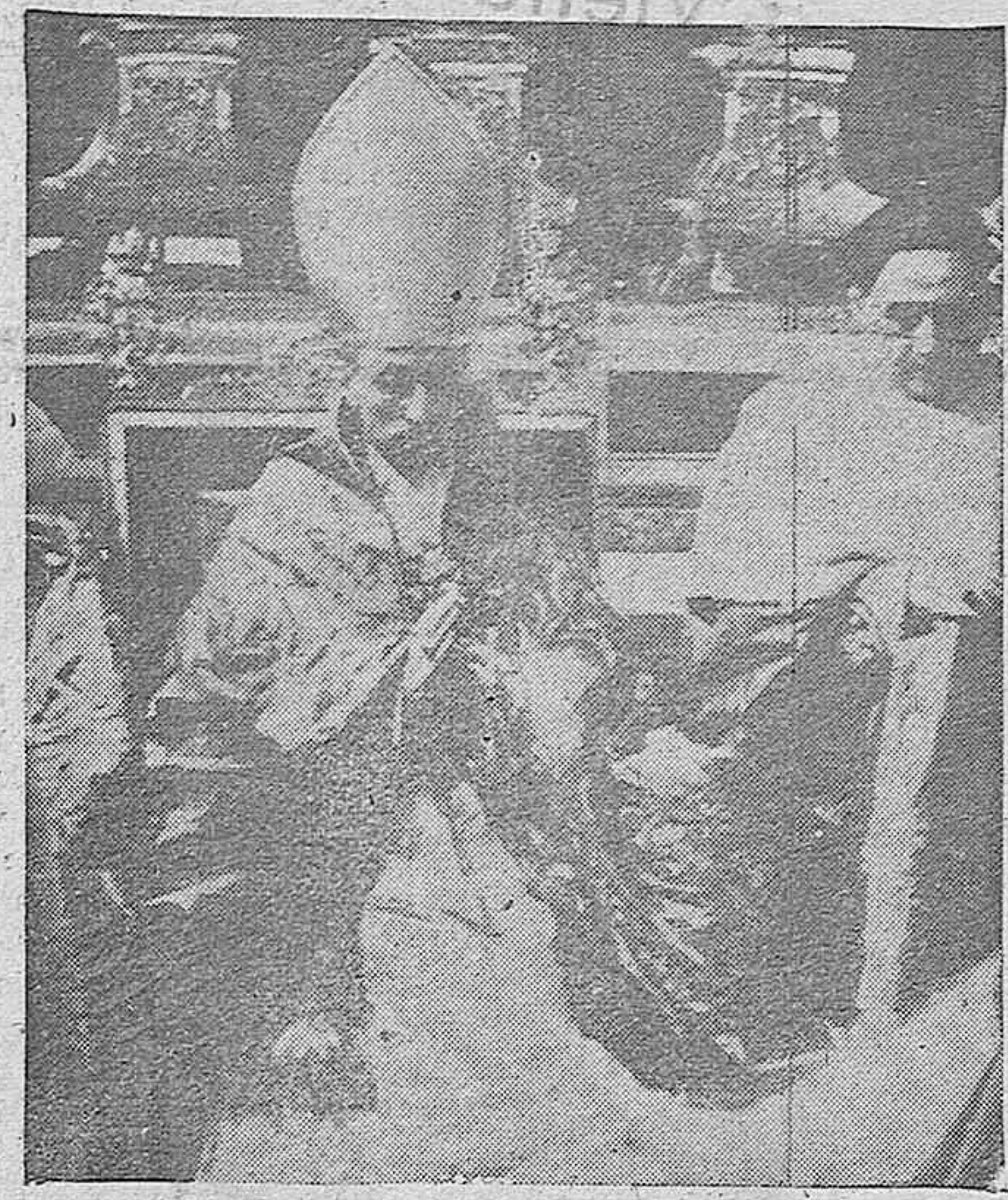
SU SANTIDAD EL PAPA PIO XII ANTES DE LA CEREMONIA DE LA CORONACION