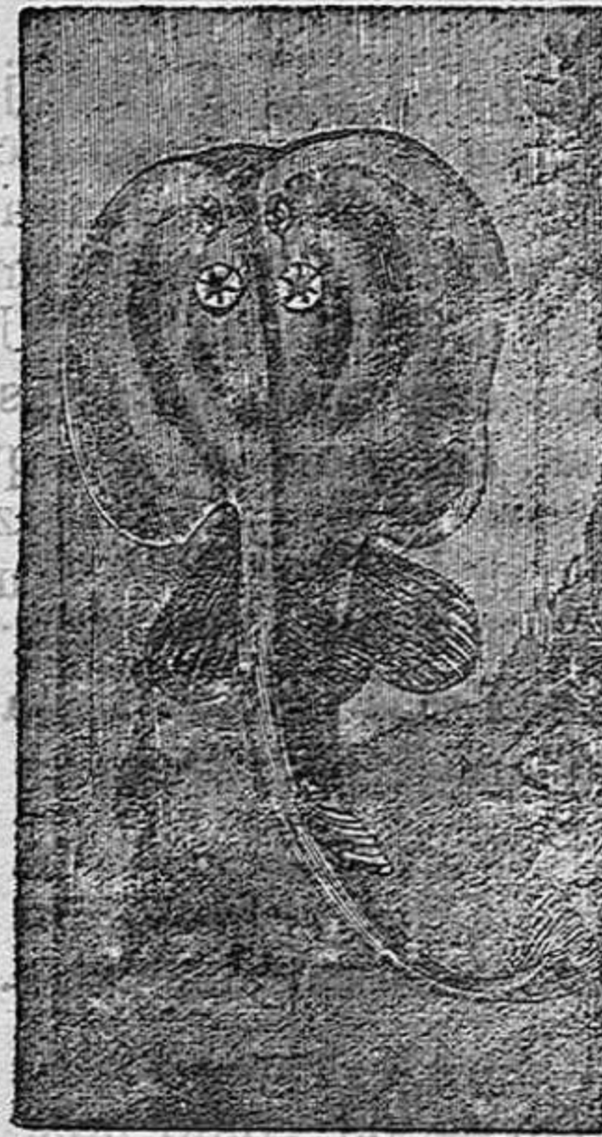
EL PEZ TORPEDO.

una de ellas ha tocado uno de estos peces, sobre los que hacia sus experimentos el sábio Walsh. Muchos hombres ilustres han comprobado estos