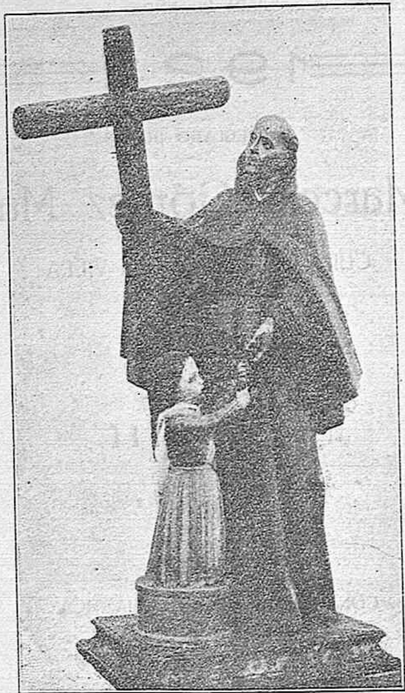
IMAGEN DE SAN PEDRO DE ALCÁNTARA COMO SE VENERA EN HERRADÓN DE PINARES EN EL MISMO LUGAR DONDE OBRÓ EL MILAGRO DE SACAR ILESO AL NIÑO DEL POZO