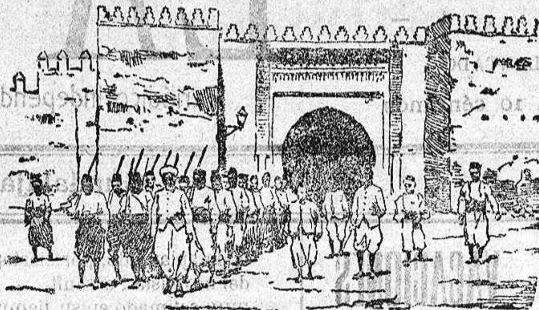
Tropas del sultán saliendo á las afueras de la ciudad á hacer instrucción

(1) Durante el año de 1909 y en el de 1910 hasta la fecha, se han decomisado en el Matadero general de Barcelona 22 cabras afectadas de tuberculosis.