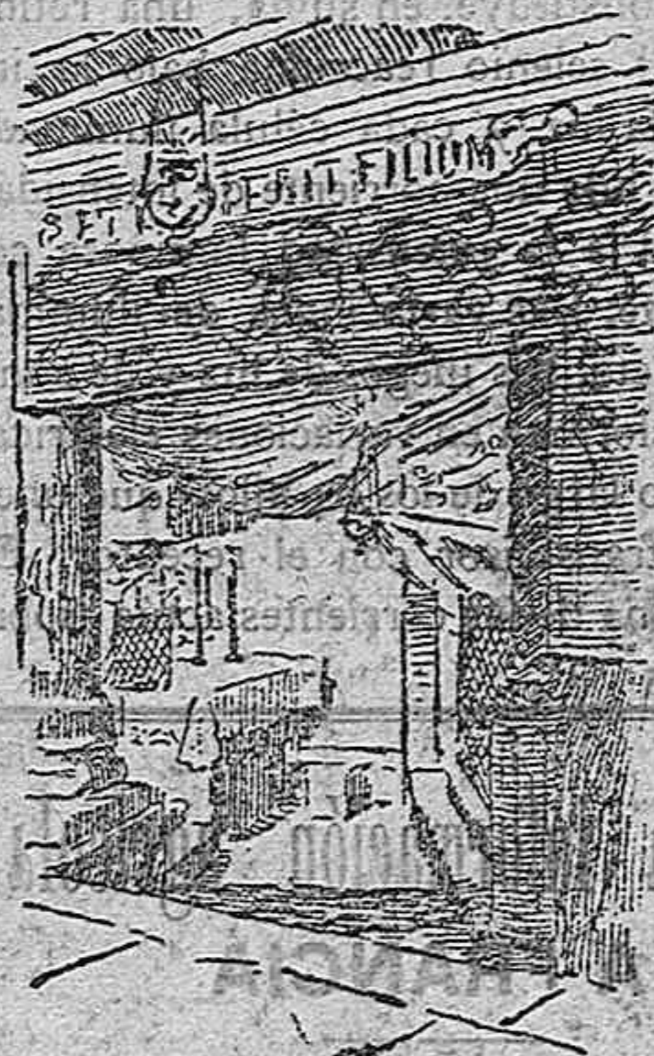
El Nicho del Pesebre

Ante el nicho se extiende la habitación de 12 metros de ancho por cuatro de largo, con las paredes talladas en mármol blanco, cubiertas en parte por colgaduras de púrpura y oro y con innumerables lámparas pendientes de la bóveda.