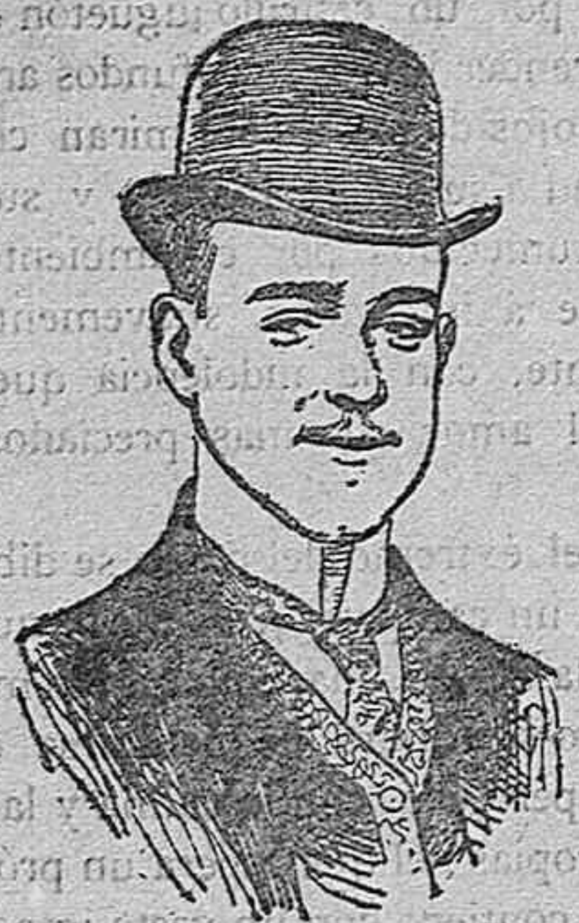
S. M. el rey de Portugal D. Manuel II.

Verdad es que tales individuos se llaman católicos por sarcasmo, pues les es más cómodo guiarse por la ley de un capricho, que por la Ley de Dios.