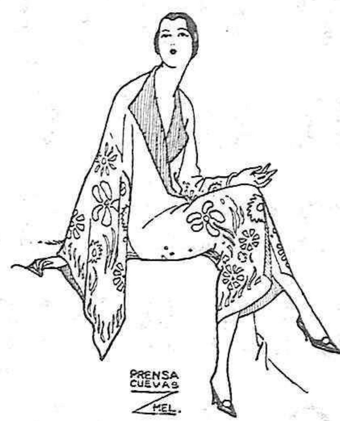
PRENSA CUEVAS MEL

No necesitó gendarmes ni gente armada para triunfar. Su palabra elocuente enardecía a las gentes, y los pueblos le creyeron y le ofrecieron sus manos y su dinero (manos y francos benditos por Dios) y las piedras volvieron a sus sitios, y los templos se reedificaron. Aquellas gentes eran pobres; lo habían perdido todo en la guerra; y con sus pérdidas materiales, sus ganados, sus casas, sus campos cultivados y.... la sangre de su sangre, sus hijos, sus esposos, sus hermanos o sus padres, ¿cómo iban a continuar viviendo? Y vivieron. Vivieron, porque Francia tiene algo grande en sus entrañas que la hace resurgir, como lo