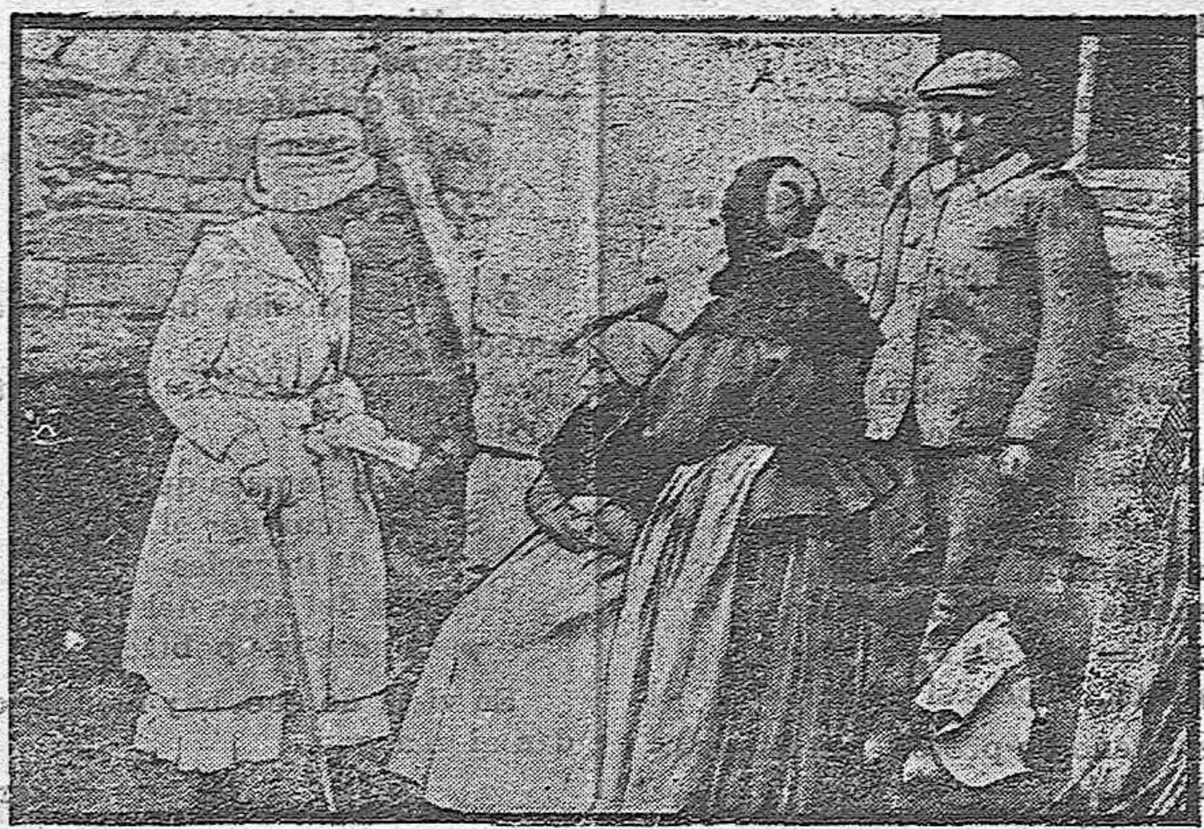
Dama del Comité Americano, visitando un pueblo reconquistado a los alemanes.

Estado recalcitrante se vería obligado por el poder militar de otros estados, a aceptar la intervención del Tribunal internacional. ¿Y si la potencia ó potencias recalcitrantes, son como ahora, las más fuertes? No serán ciertamente las débiles jantas quienes las pongan a raya. Supongamos, por ejemplo, dice la citada revista, que la India pide al Tribunal internacional su independencia, y que hace lo mismo Egipto, y que España reclama Gibraltar, ¿se sometería fácilmente Inglaterra? Aunque el pueblo inglés tiene en su sangre el principio de libertad, difícilmente dejaría la India a las disputas entre indios y musulmanes, ni expondría Egipto, donde ha llevado a cabo asombrosa labor, a la destrucción de las tribus del desierto, aunque lo dispusiese así un Tribunal internacional. ¿Estarían, acaso, mejor dispuestas las naciones arrogantes y que tienen el orgullo de la espada en su sangre? Dice muy bien el periódico americano: Evitar las guerras es empresa muy sobrehumana, particularmente las grandes, entre poderosos, sólo después de haberse destruido uno a otro y quedar malparados entrambos. Oros se encumbrarán tras ellos, y una vez encumbrados, no habrá papa que les excomulgue, ni Conferencia ó Tribunal internacional que los contenga. La experiencia de la actual guerra no les servirá de escarmiento, sino de aprovechamiento y enseñanza.