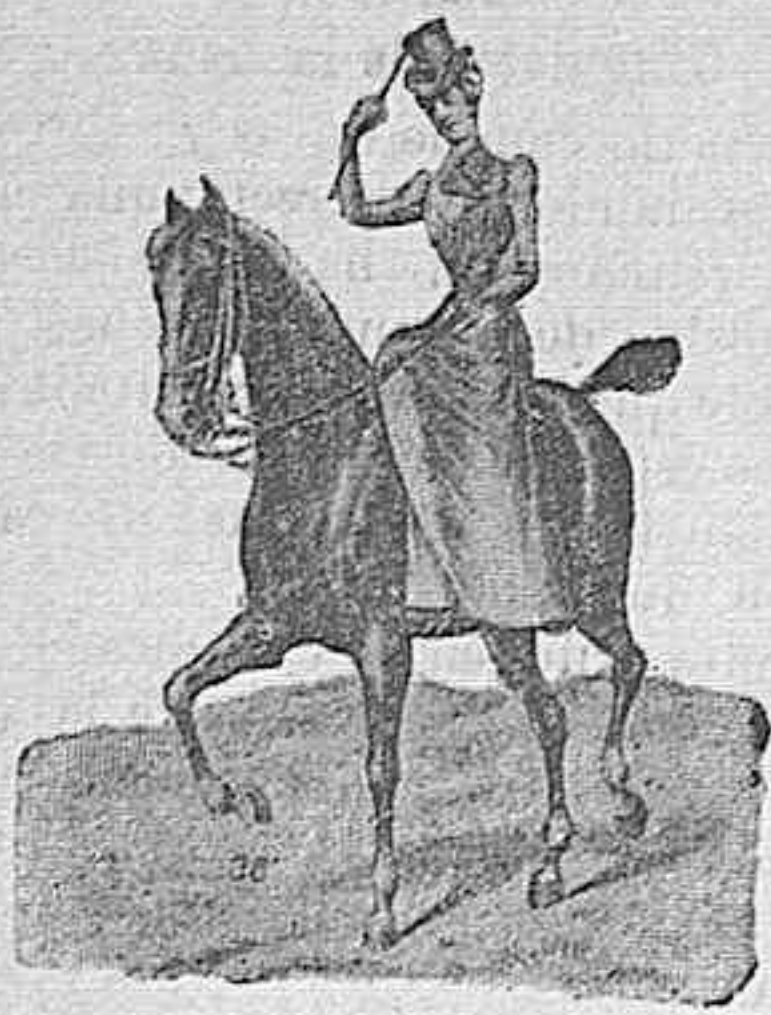
Figura 36.—Traje de amazona, para cacerías ó paseo, cuerpo y falda, 200 pesetas., pantalón, 30 pesetas.

Relojería de Alvarez Comercio, 25—Toledo.