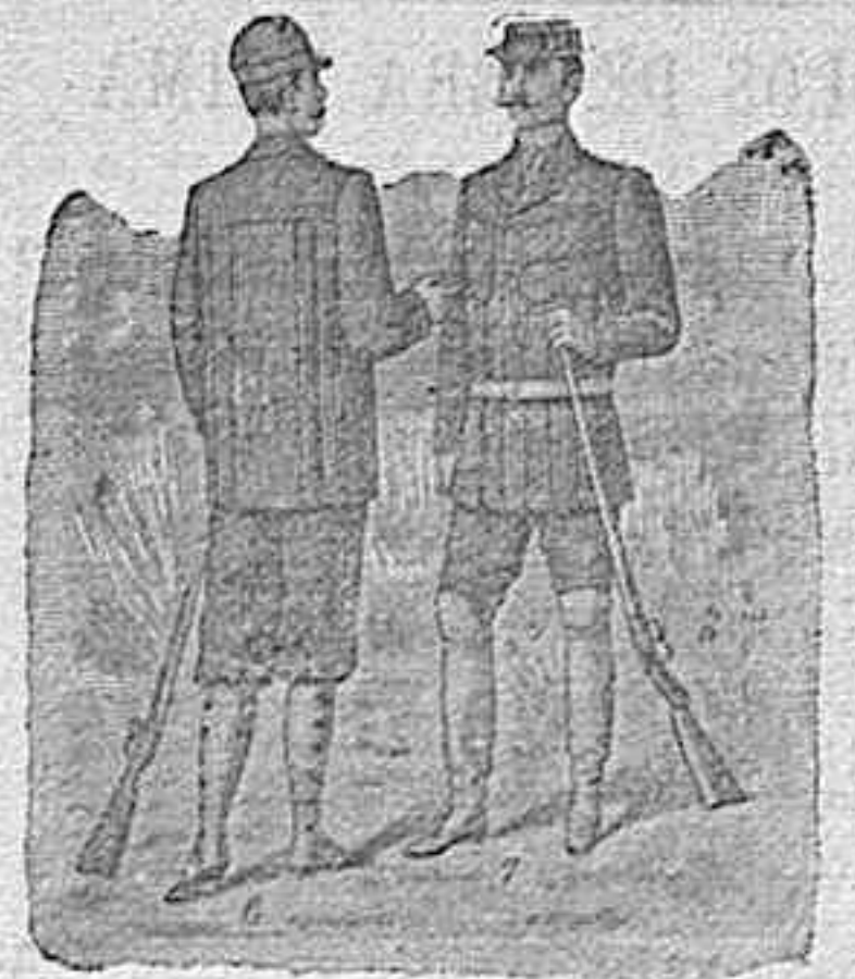
Figura 6.ª—Traje de patén á rayas, lleva la americana seis bolsillos fuera, cuello á la marinera, pantalón bombacho con puño, 80 pesetas.

DE NUESTRO CATÁLOGO DE PRENDAS DE GAZA, CAMPO Y SPORT MOISÉS SANCHA CRUZ, 12, MADRID