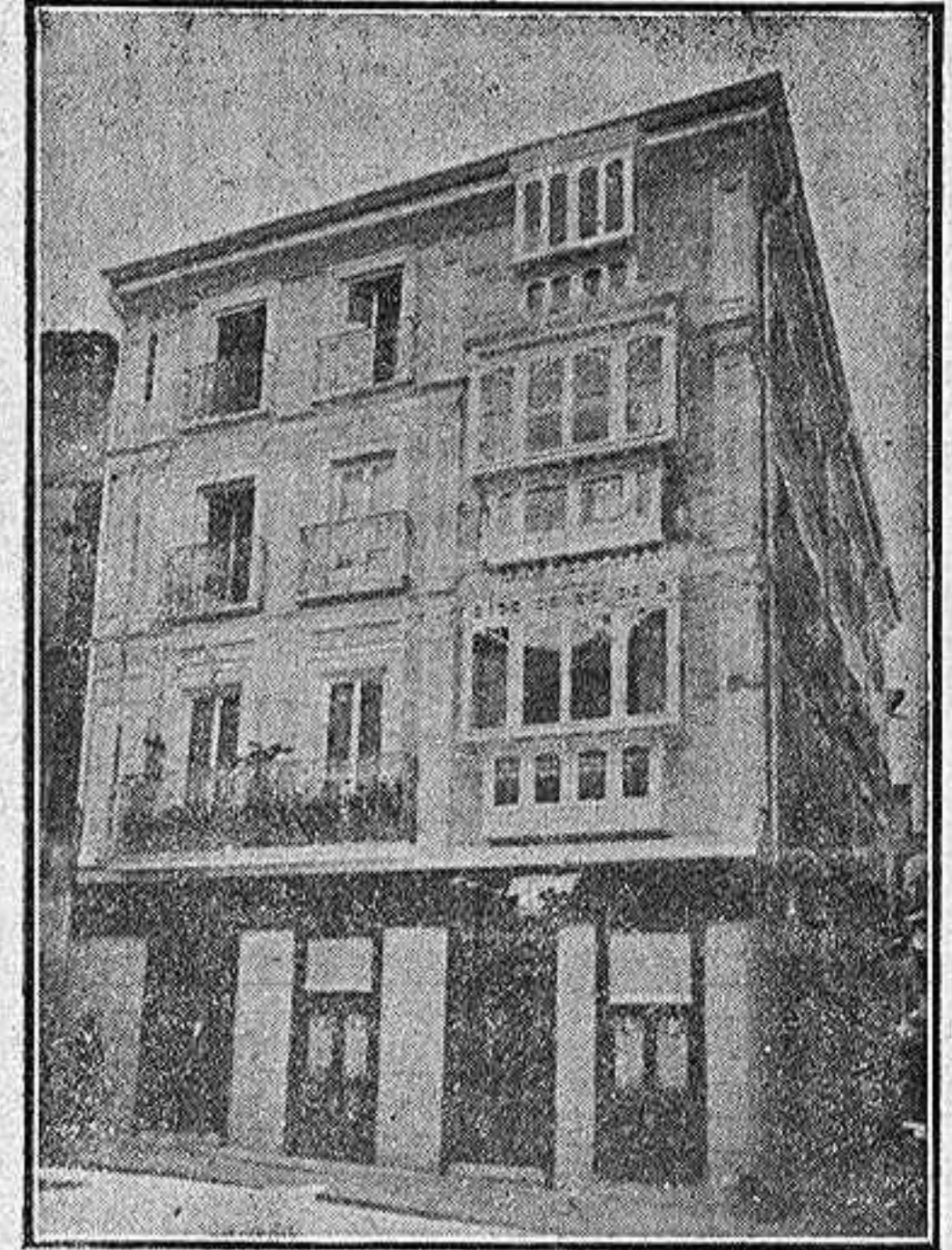
Barrio Rey, 2, 4 y 6, Teléfono 14, TOLEDO