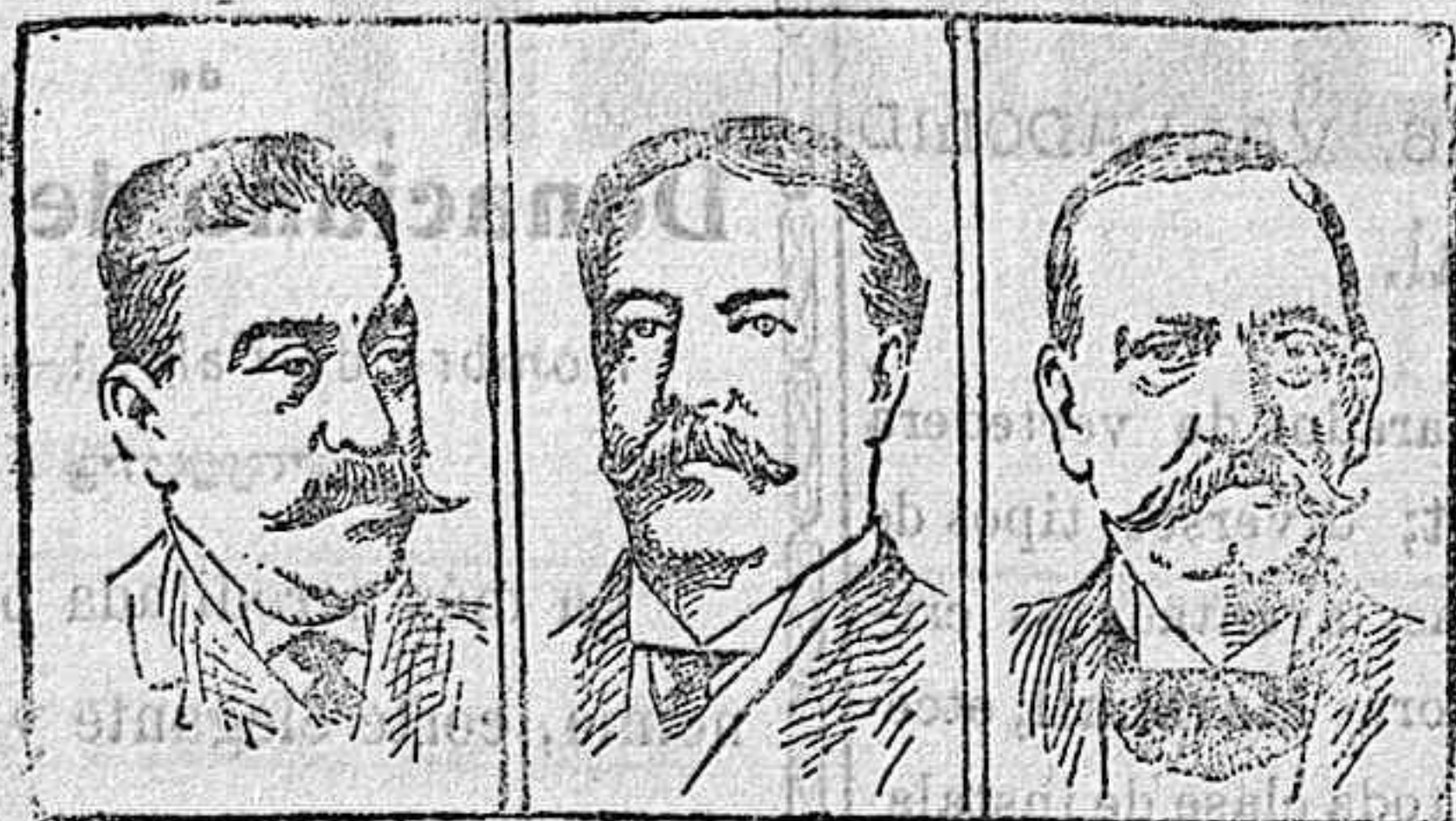
General GOMEZ Jefe de los revolucionarios. M. TAFT Gobernador general interino de Cuba. M. PALMA presidente de la República cubana

Hagan los Estados Unidos las protestas de sinceridad que quieran respecto á los propósitos de no desear la anexión de Cuba á sus dominios, la intervención es ya un hecho con el establecimiento de un gobierno militar, primer estorbo de la agonía en que ha entrado la independencia de la República cubana.