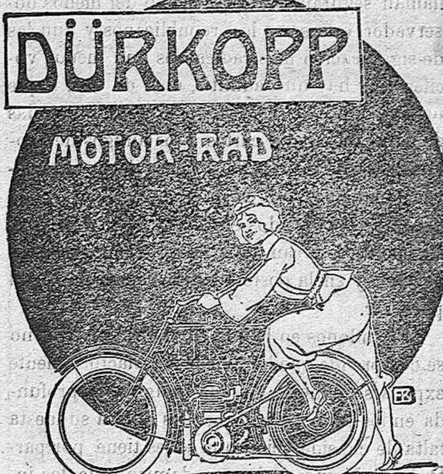
DURKOPP & C. A. G. BIELEFELD.

GARANTIZAMOS de igual modo una suavidad extraordinaria en los rozamientos de estos nuevos juegos, mediante los que se obtiene la más ligera marcha y la mayor facilidad para subir las cuestas. Infinidad de testimonios á disposición de nuestros favorecedores. Pídanse catálogos de Bicicletas, Motocicletas, Automóviles y de accesorios en español, mediante la remisión de franqueo á la DELEGACION GENERAL PARA ESPAÑA Y PORTUGAL: OTTO STREITBERGER, Apartado de Correos 335, Barcelona.