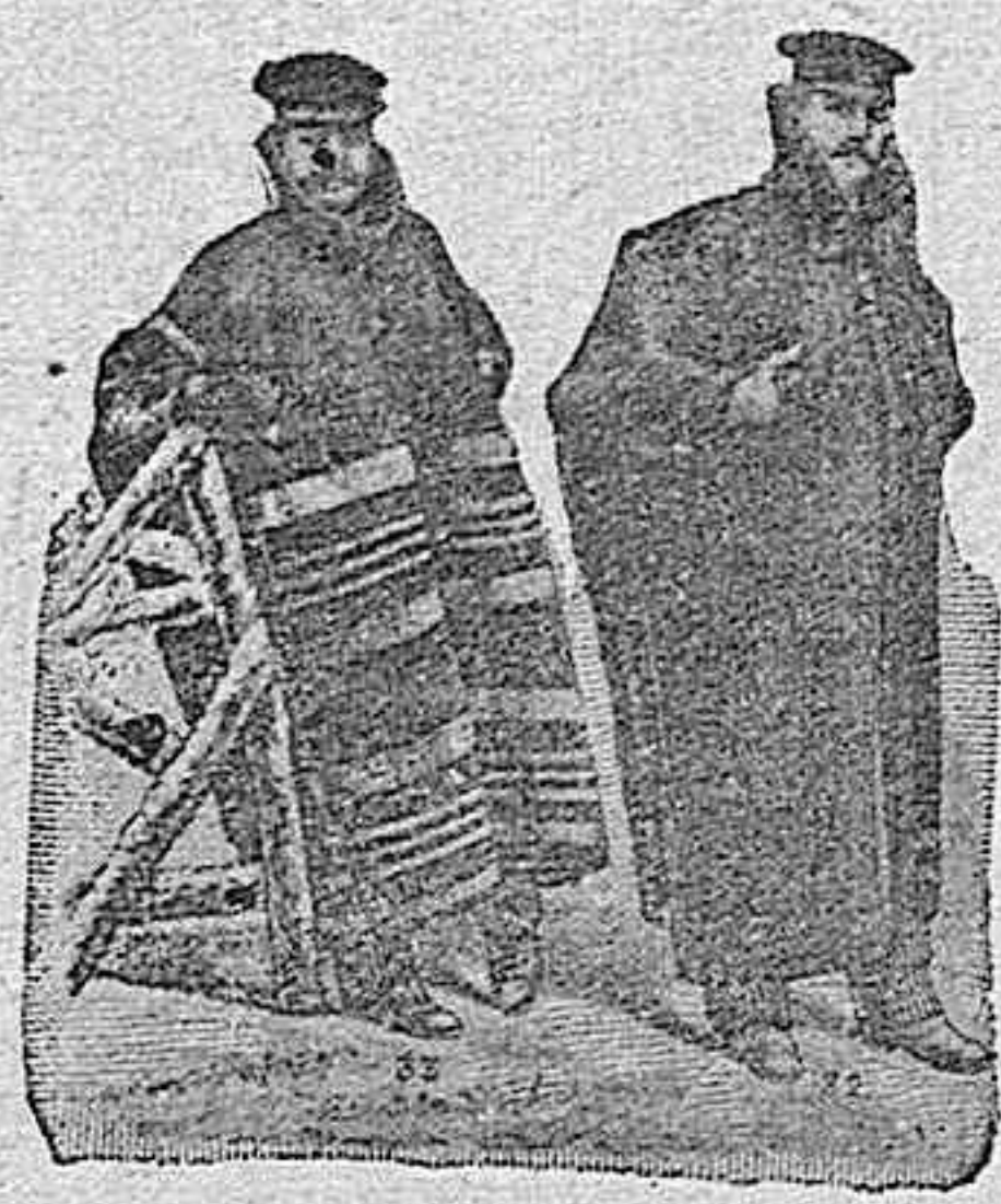
Figura 32.—Capote segoviano, color café y rojo, de mucho abrigo, impermeabilizado, cuello de piel y capucha caoutchouc, 60 pesetas.

Figura 33.—Capote palentino, café con blanco, formando mangas, cuello de piel, capucha portátil, 70 pesetas.