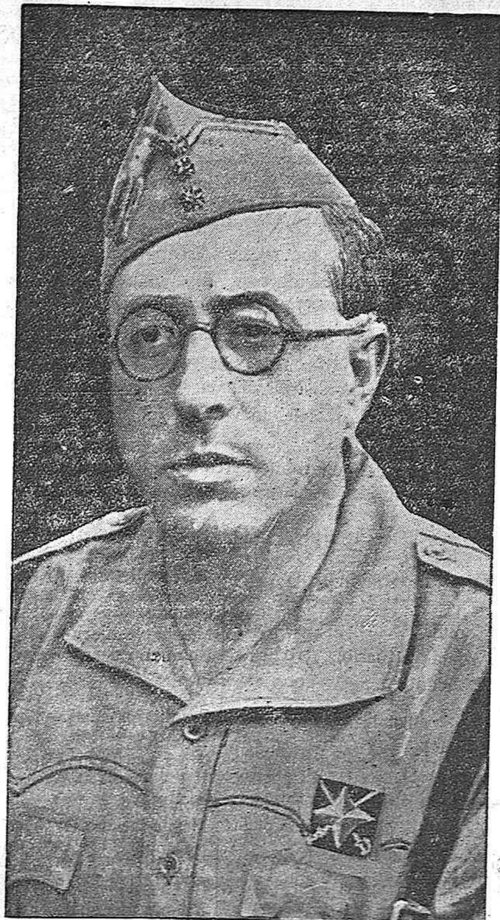
El glorioso y heroico GENERAL YAGÜE, que hace un año, al mando de las columnas expedicionarias, sembraba de triunfos la ruta gloriosa de Sevilla a Badajoz

En este aniversario triunfal recordamos la epopeya de las armas nacionales en la liberación de Extremadura.