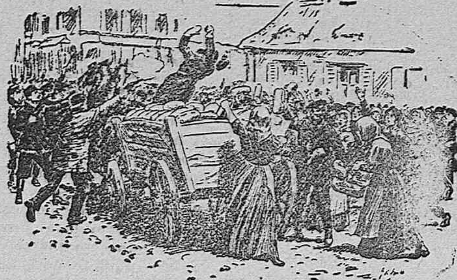
Asalto por el pueblo, en Varsovia, de un carro cargado de pan para el ejército.

del vecindario, se oye el rumor lejano de las comparsas que á paso de carga y rascando violines, soplando flautas y golpeando el parche, cruzan como meteoros por las calles haciendo recordar los tiempos felices en que los estudiantes de verdad corrían el tación por todos los ámbitos de la península, sin gastarle un céntimo á sus queridos papás, haciendo infinidad de diabluras y labrando su porvenir.