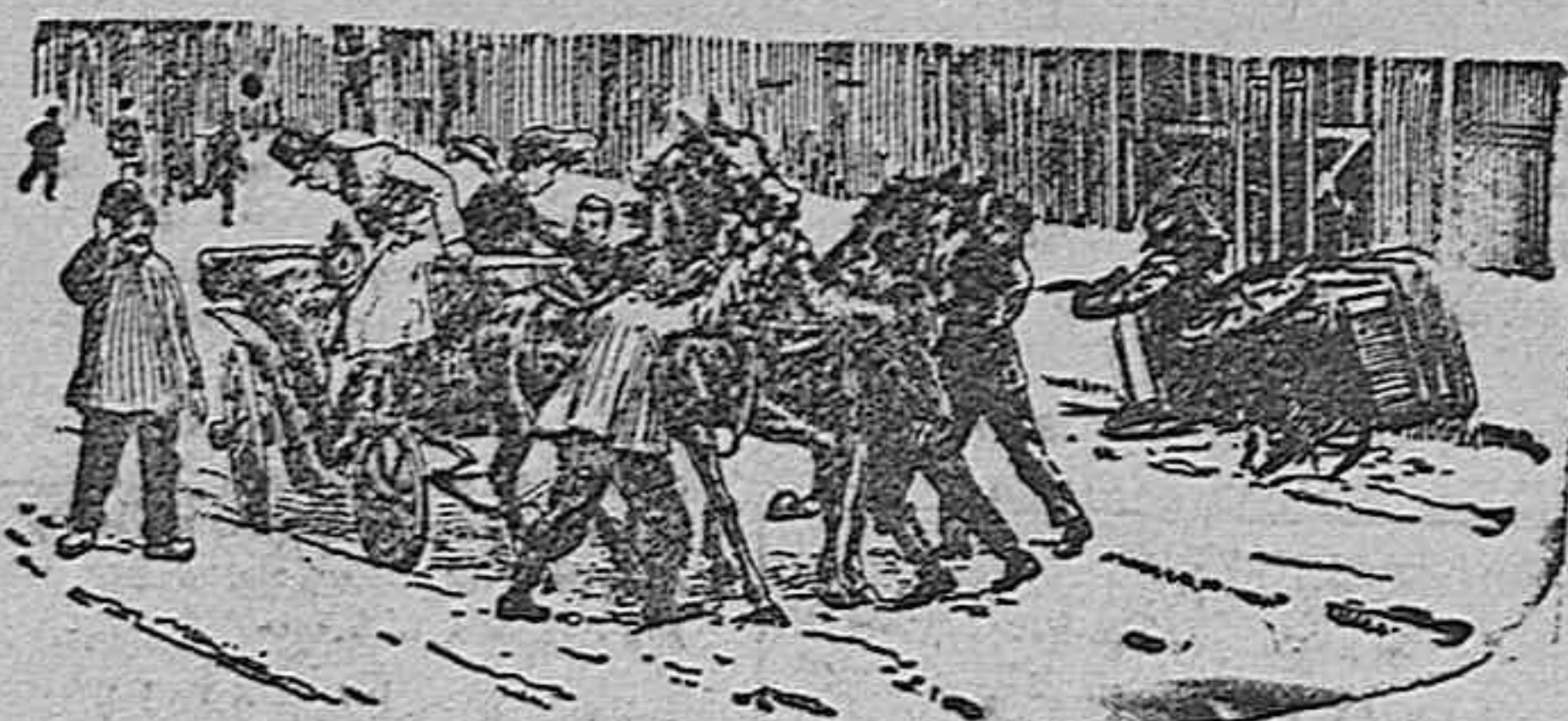
Los huelguistas en Varsovia obligando á los cocheros á abandonar sus vehículos y seguirlos.