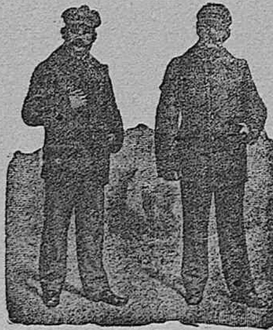
Figura núm. 14. Guarda polvo gris, para automóvil ó coche, va forrado de pieles hasta la mitad del cuerpo y mangas, por medio de una combinación de botones, queda formando pantalón, por lo que constituye un poderoso abrigo, 250 pesetas.—Figura núm. 15. Traje de última novedad, el canesú de la espalda y delanteros rematan en caprichosos medios puntos. El cinturón es de la misma tela ó cuero, en pana ó paten. 90 pesetas. En pana alemana, nevada, diferentes colores, 140 pesetas.

De nuestro Catálogo de prendas de caza, campo y sport.