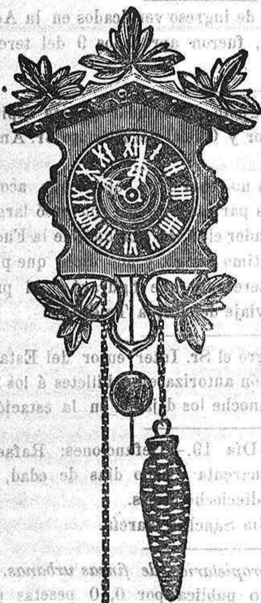
El reloj de regalo

Los pedidos de nuestros relojes de regalo, los serviremos de quince en quince días, tiempo necesario para recoger notas y hacer las compras.