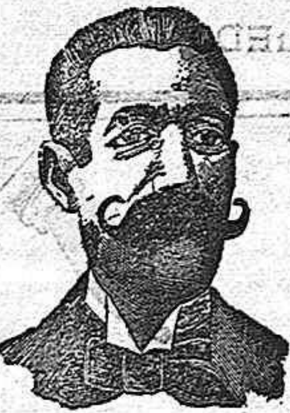
COSTANZI 284—Diputación—284. BARCELONA