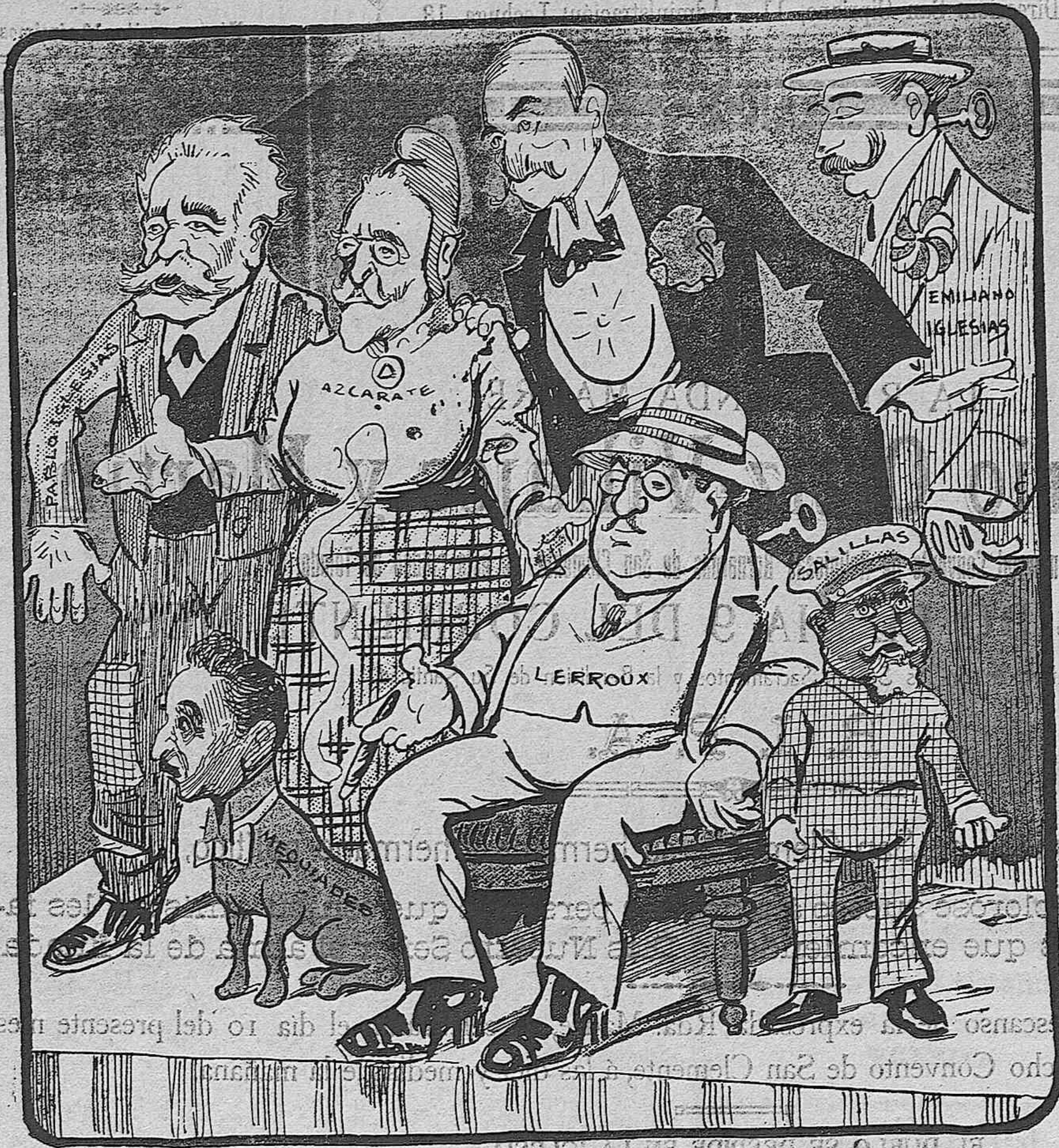
(De El Fusil).

Estos muñecos, entre otras gracias, hablan, se agitan, van y vienen y hacen que se enfadan; pero lo que más llama la atención es verles comer.....; tragan sin medida, y cuando comen callan. Mister Romanones es felicidadísimo por sus éxitos, y la Empresa que, aunque inglesa, es de empuje....., asegura, con números como el actuante, la coronación del negocio. ¡Qué perra!... la conocida por «Melquiades».