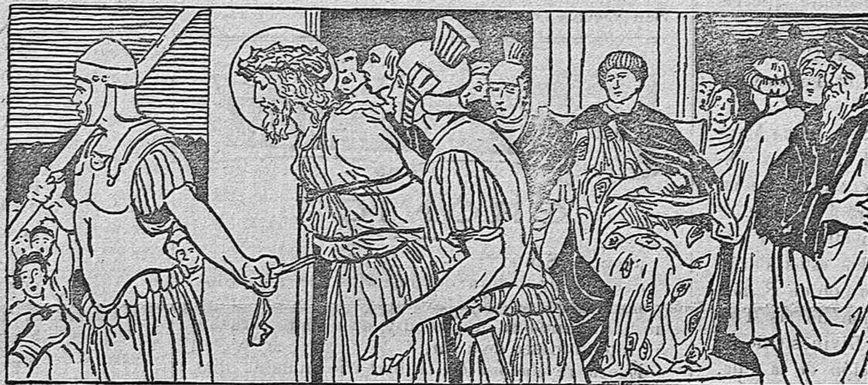
Jesús en el Pretorio.

Es la voz redentora, que suena con dulzuras de melodía en sus oídos, que hasta entonces solo oyeron lisonjas y galanteos, es la palabra que re-