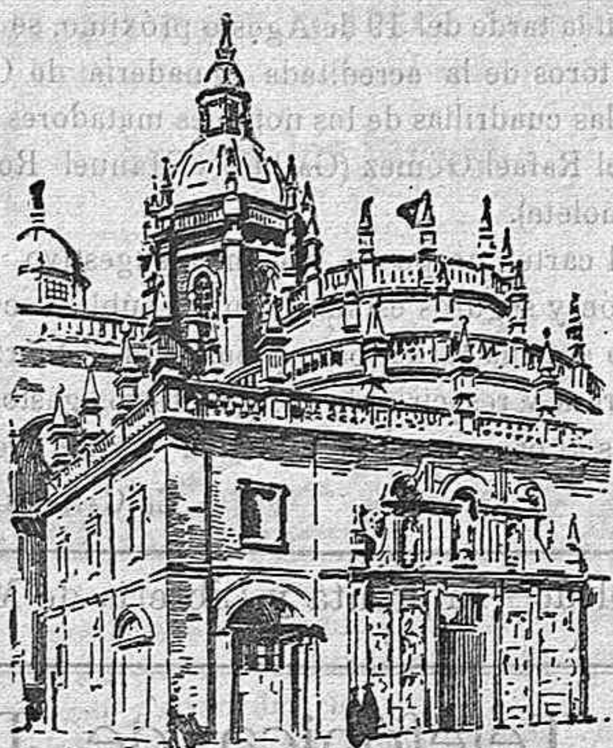
Puerta Santa de la Basílica.

Las fiestas del Santo Apóstol son para Galicia el acontecimiento más grande del año. Lo más saliente de ellas lo constituyen las solemnidades religiosas que se celebran en su basílica, cuyo conjunto, apesar de lo inarmónico de su fábrica, abruma por sus grandiosas proporciones, pues ocupa un área, incluyendo el palacio azobispal, el claustro y dependencias, de 8.100 metros cuadrados.