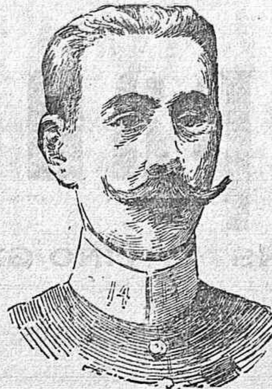
El general Lyantey.

Últimamente ha reforzado el ejército de ocupación con importantes elementos, designando para mandarlo á un jefe de superior categoría que Drupe, y de tantos prestigios en el Estado Mayor francés como el general d'Amade, célebre por sus estudios sobre la guerra anglo-boer, á la que asistió como agregado militar. A estos dos importantes hechos hay que agregar la toma de la alcaraba de Mediuna, que tal vez sea el primer jalón que se ha colocado para ir á la conquista de los territorios que separan á Casablanca de Rabat.—Al mismo tiempo que tiene efecto estas importantes resoluciones del Gobierno francés, el ejército del general Lyantey, jefe superior de las tropas argelinas, bajo