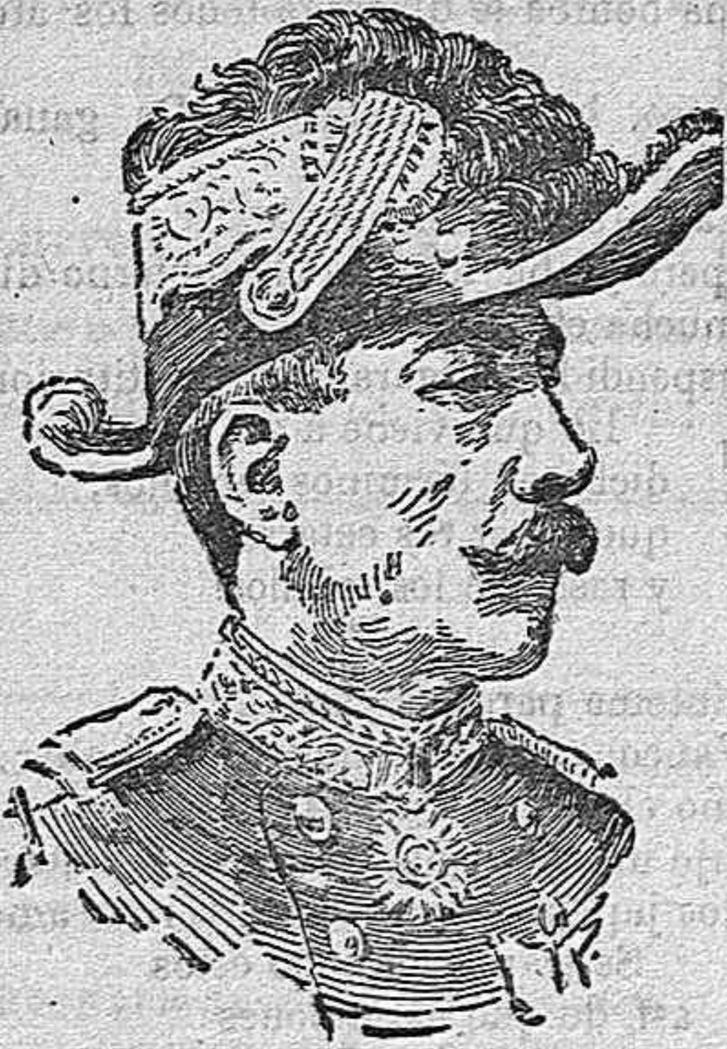
El general d'Amade.

¿Cuáles son los propósitos de Francia sobre el problema marroquí?—Esta es la pregunta que se escucha en estos días donde quiera que se reúnen dos personas que por curiosidad ó por propio interés siguen atentamente el proceder de las tropas francesas de la frontera argelino-marroquí y en el interlank de Casablanca.—Contra lo que no há mucho se aseguraba, Francia no tiene trazas de abrigar el propósito de repatriar el ejército de Casablanca, sino todo lo contrario.