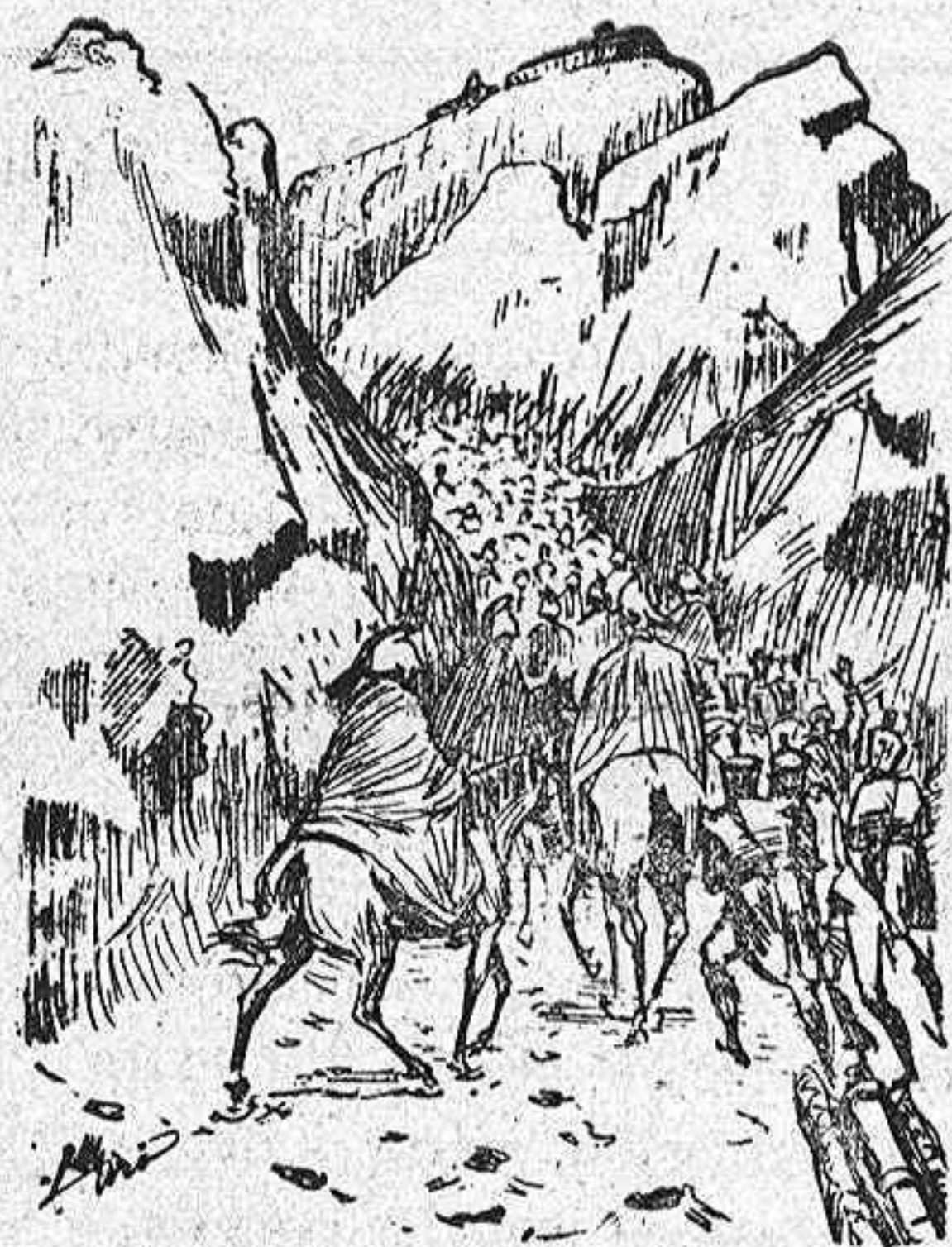
Faso del monte San Bernardo, por los ejércitos de Napoleón I.

Cuando el célebre Napoleón en su bélico paseo por Europa, pensó en la conquista de Italia, á la sazón ocupada por las armas austriacas, encargó al general Manescot que estudiara el paso mejor para atravesar los Alpes con su ejército. Después de un detenido examen del terreno, el referido general ponía en conocimiento del gran mariscal que los soldados franceses podían atravesar el monte de San Bernardo.