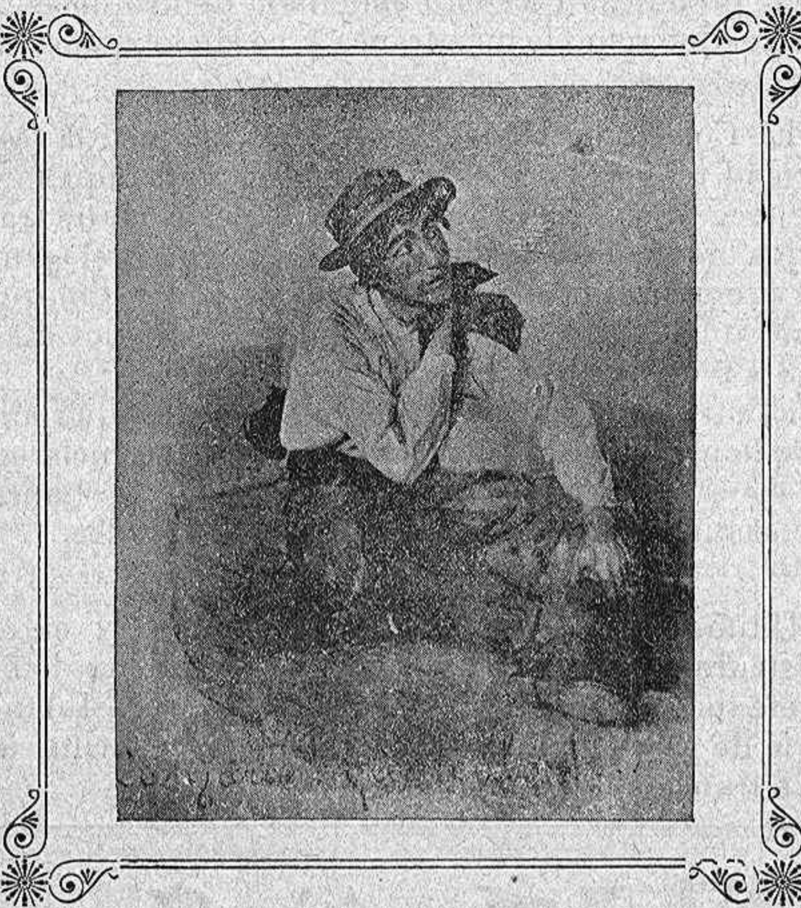
En el «Paño de Rosas.»

ponde á sus amorosas aspiraciones, son las más interesantes; á mí estos sujetos me encantan, los tergo verdadero cariño, en ellos flota un bello romanticismo que les hace extremadamente simpáticos. La intensidad y duración de la tristeza en estos individuos está en relación con su impresionabilidad, gusto é ilustración.