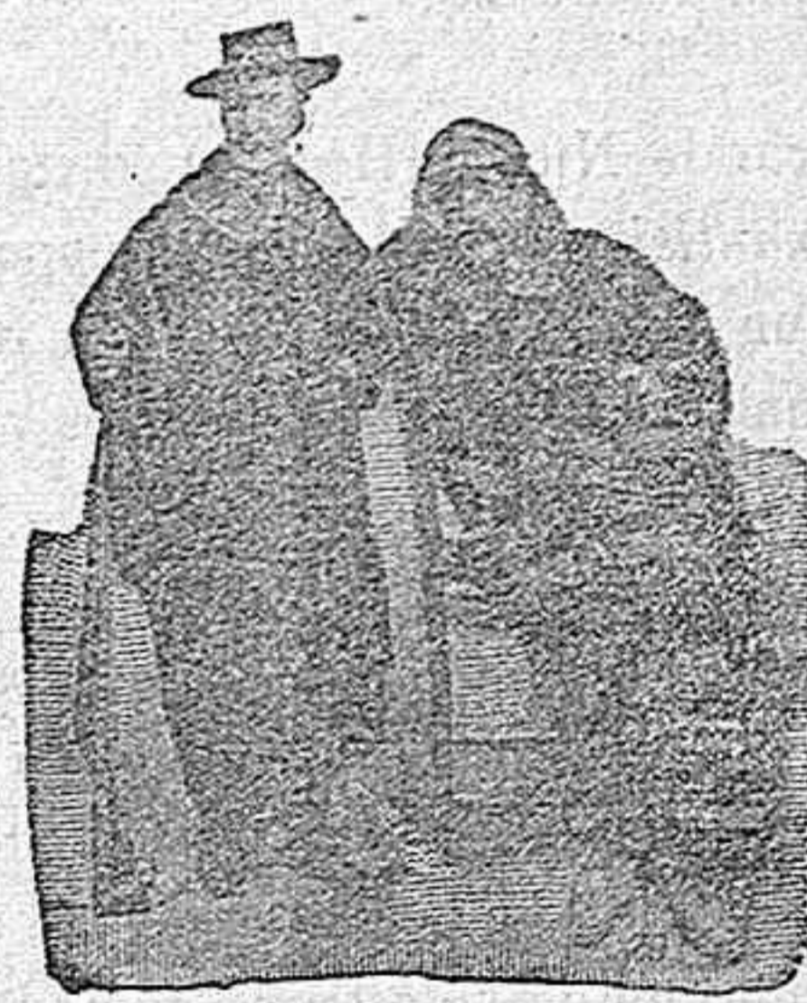
Figura 28. Capote gris, impermeabilizado, cuello de piel, capucha caoutchout, con embozos de astracán, 80 pesetas.—Figura 29. Capote granadino, gris ó negro, impermeabilizado, cuello piel, capucha portátil, mangas de paño y porta-capote, 80 pesetas.

DE NUESTRO CATALOGO DE PRENDAS DE CAZA, CAMPO Y SPORT