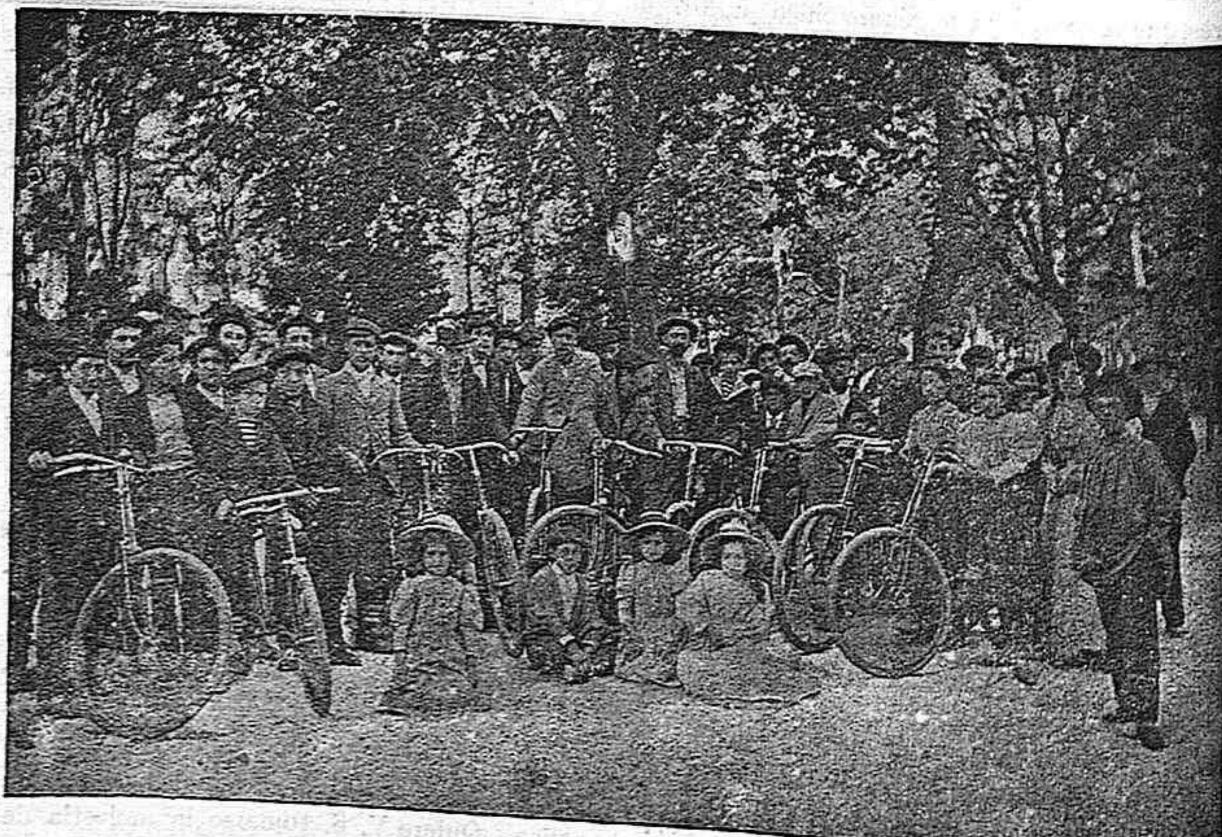
Grupo de excursionistas.

sión de muchos, que á los muelles de Barcelona han acudido unos 2.000 individuos entre republicanos, carlistas y curiosos, y que el recibimiento ha sido, como se esperaba, bastante frío.