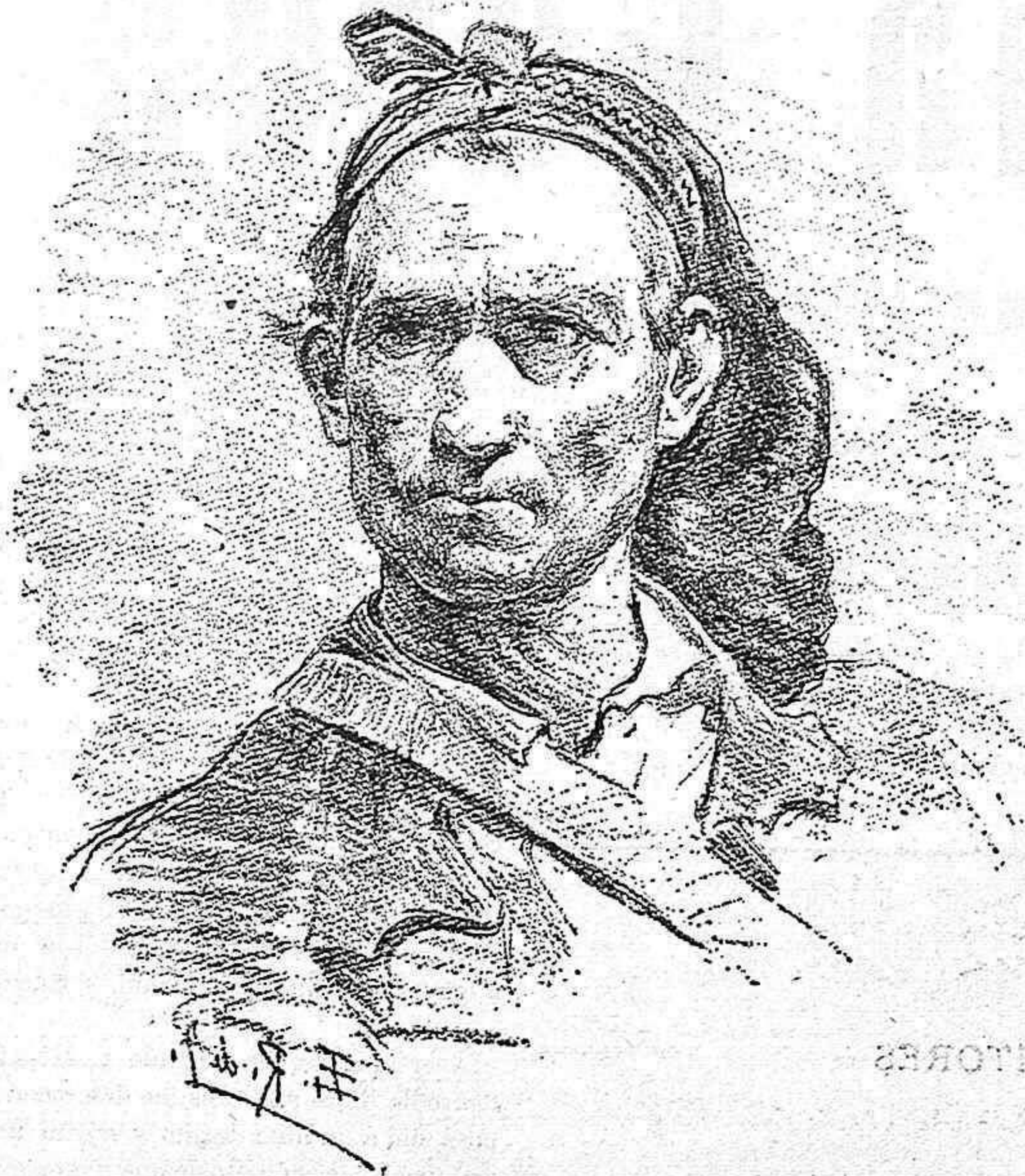
UN GUERRILLERO. (Dibujo de Romero de Torres).