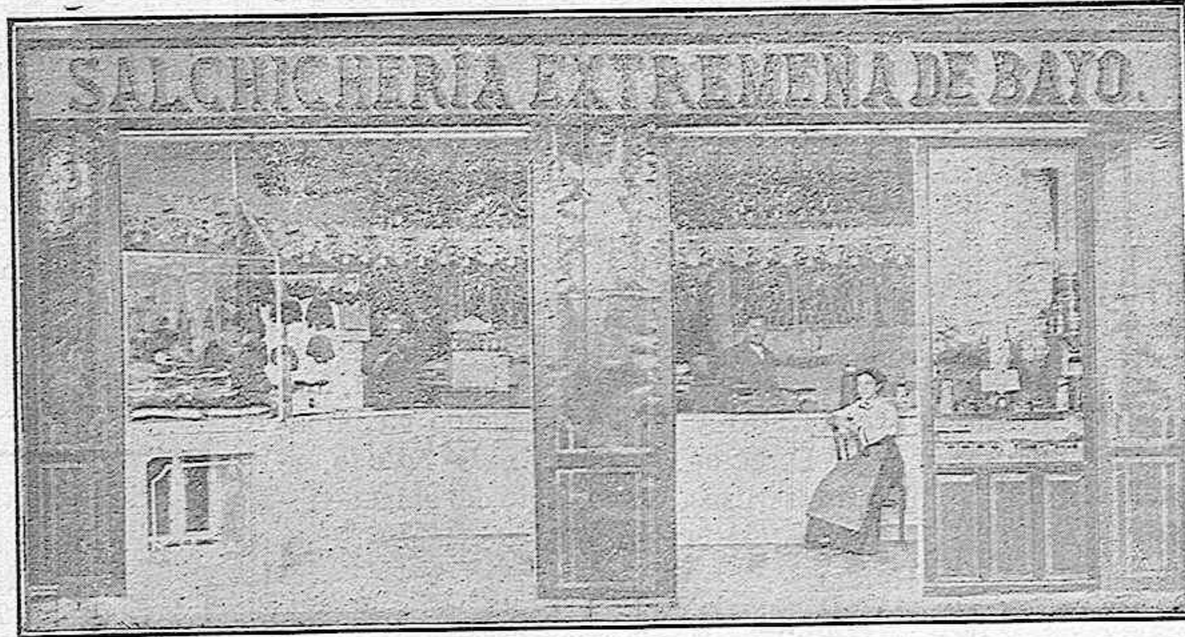
(Es la casa más antigua y acreditada de la población).