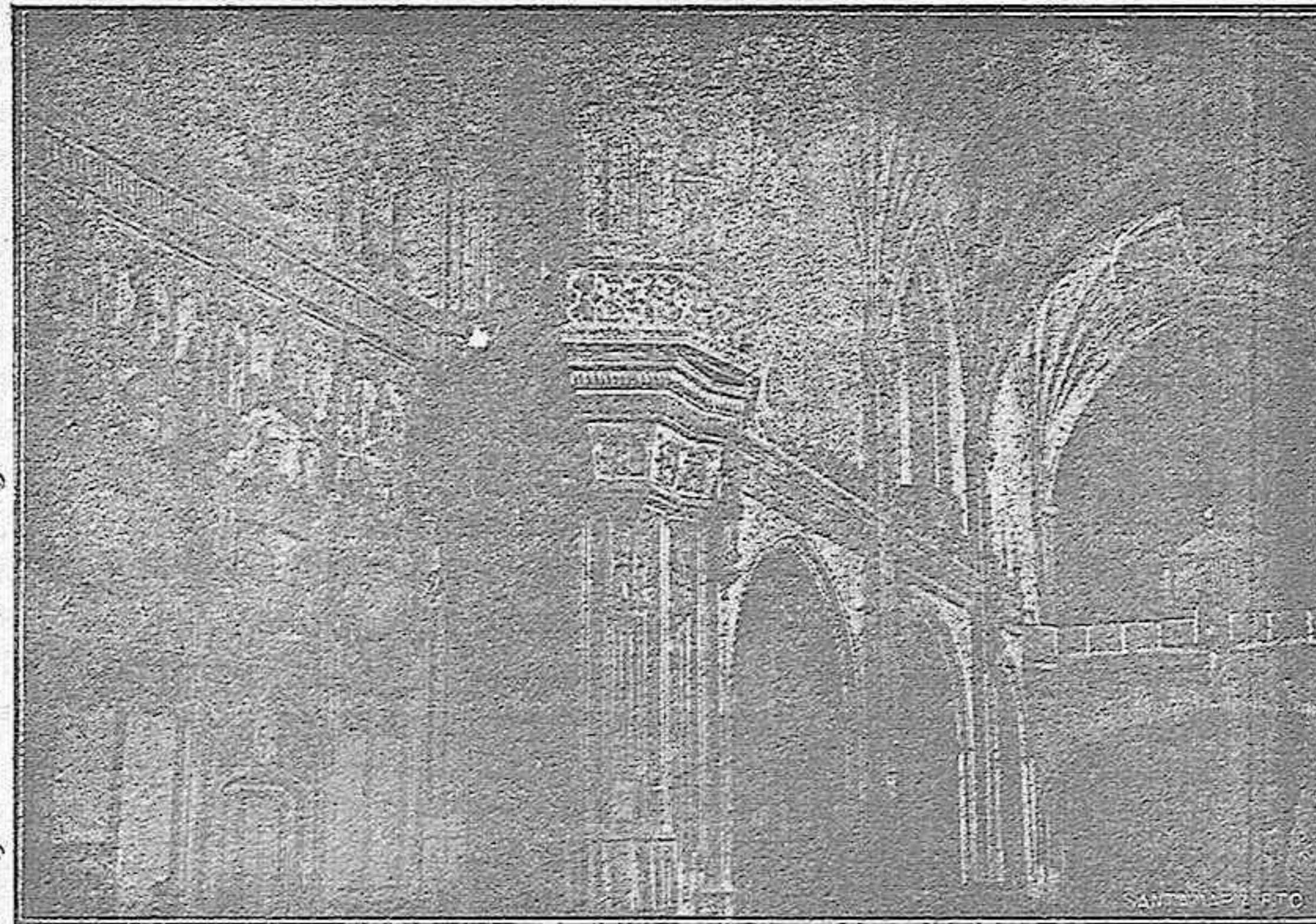
SAN JUAN DE LOS REYES Interior.