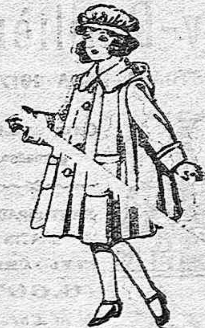
Abrigos de paten, para niñas de 4 a 9 años, de pesetas 22 a 33.