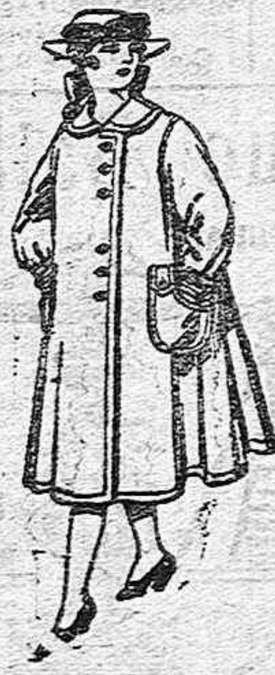
Abrigos de lana para jovencitas de 11 a 15 años, de ptas. 35 a 40