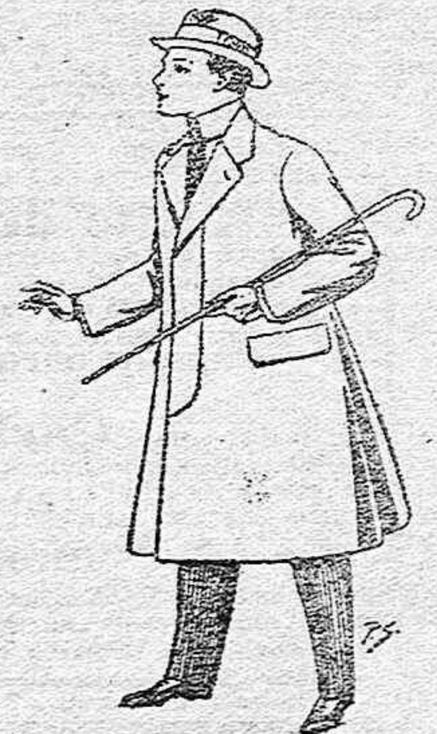
Gabanes de lana, vigenia o melton, con forros saten e seda, para niños de 10 a 12 años, de pesetas 20 a 53.