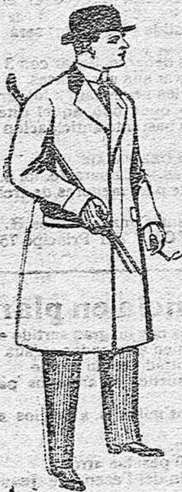
Gabanes de paten, melton y cheviot, con forros seda, saten o escocés, de pesetas 33 a 100.