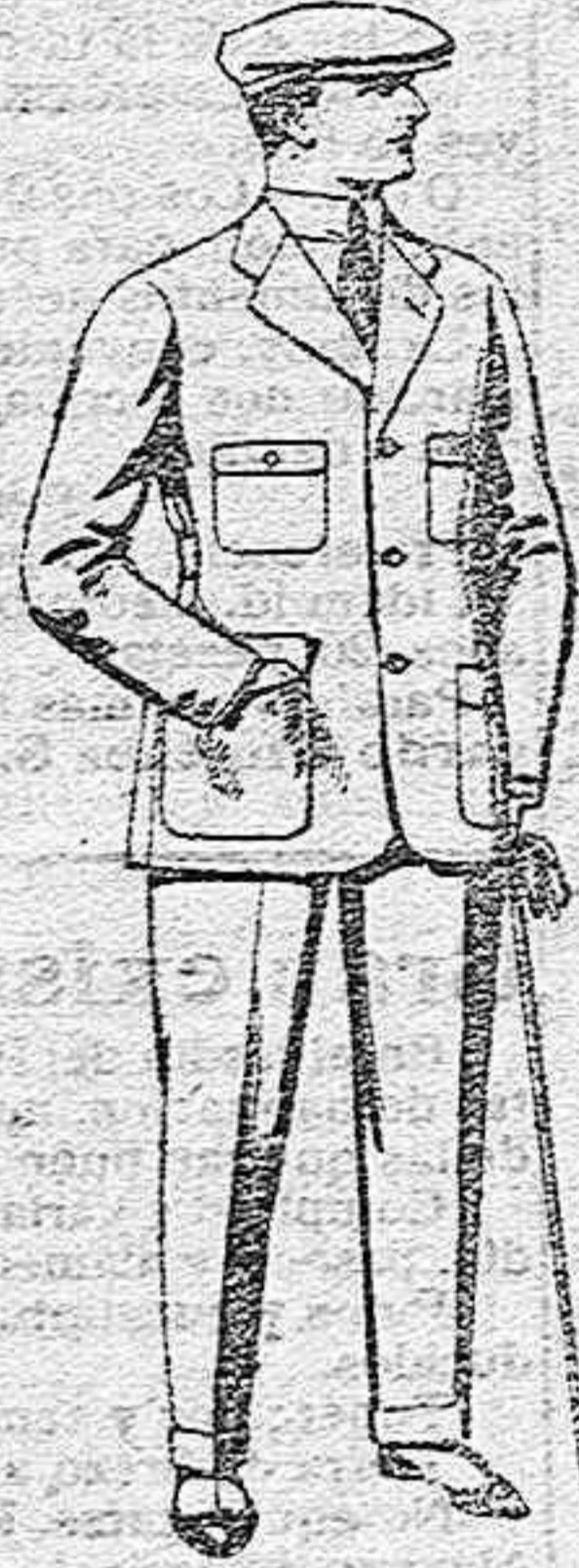
Trajes de cheviot, corte elegante, para sportman, de ptas. 45 a 55.