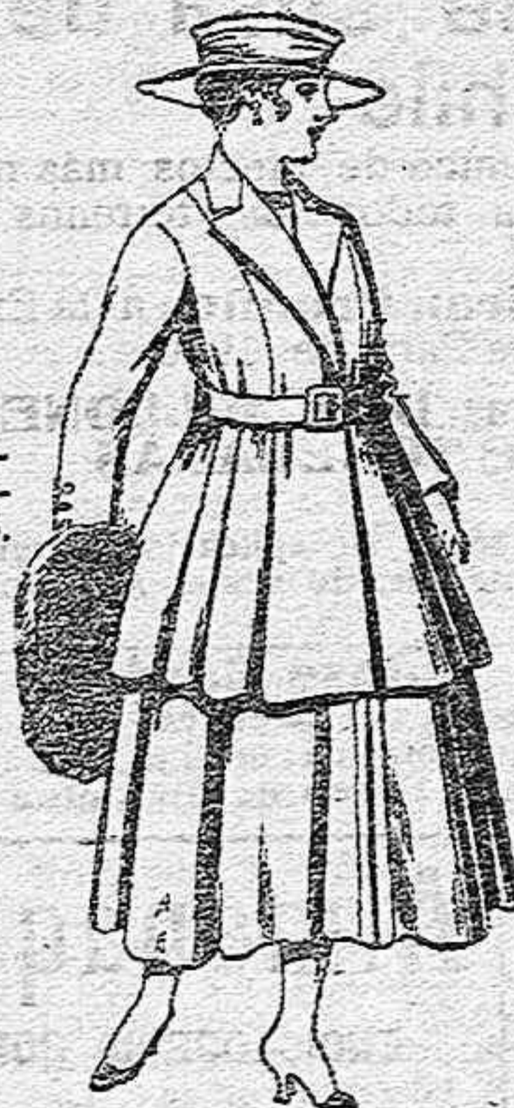
Traje de lana para señora, en color negro y azul, de pesetas 85 a 100.