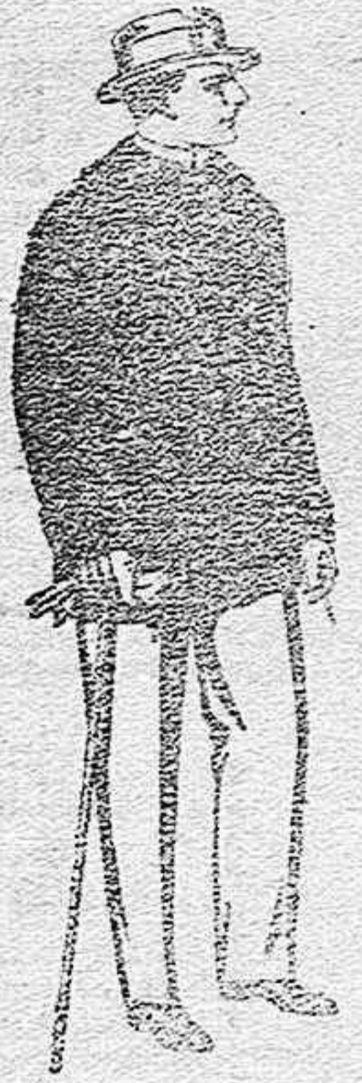
Pelliza de ratina con cuello del mismo género y con astrakan, de pesetas 33 a 110