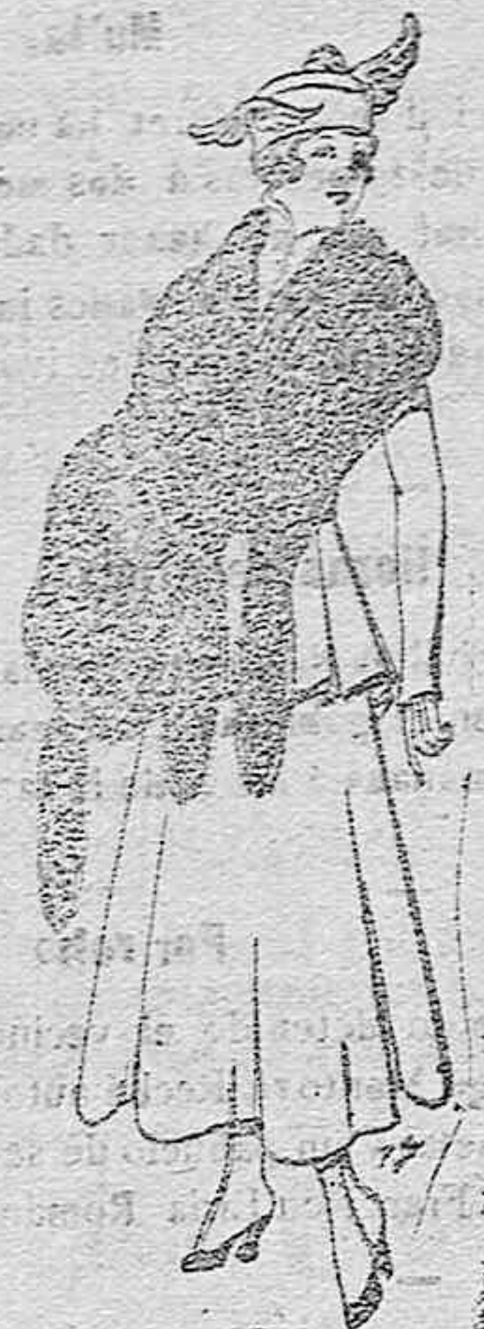
Juego de pieles imitación perfecta al renar-negro. De pts. 40 á 40