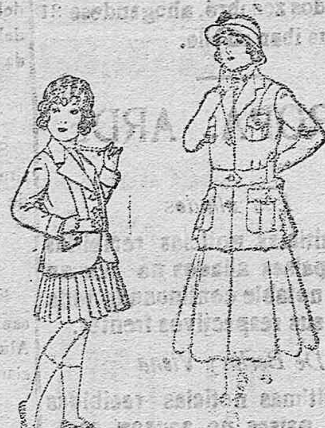
Trajes de lana para niñas de 4 á 12 años. De pesetas 20 á 35 Trajes de lana para jovencitas de 13 á 16 años. De pesetas 40 á 45