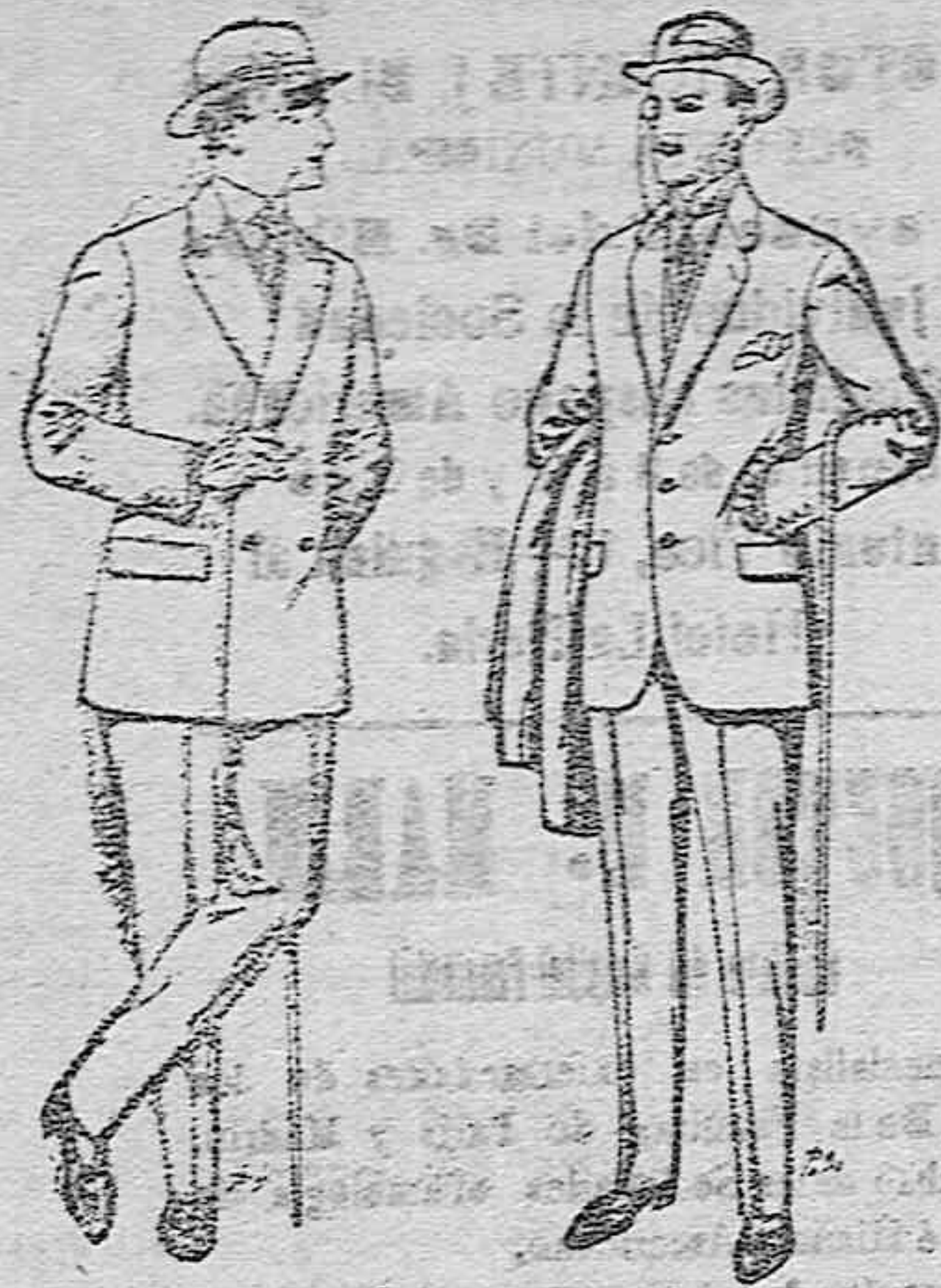
Trajes de cheviot patén, etc. De pesetas 27 á 85 Trajes de patén cheviot etcétera. De pesetas 17'50 á 80