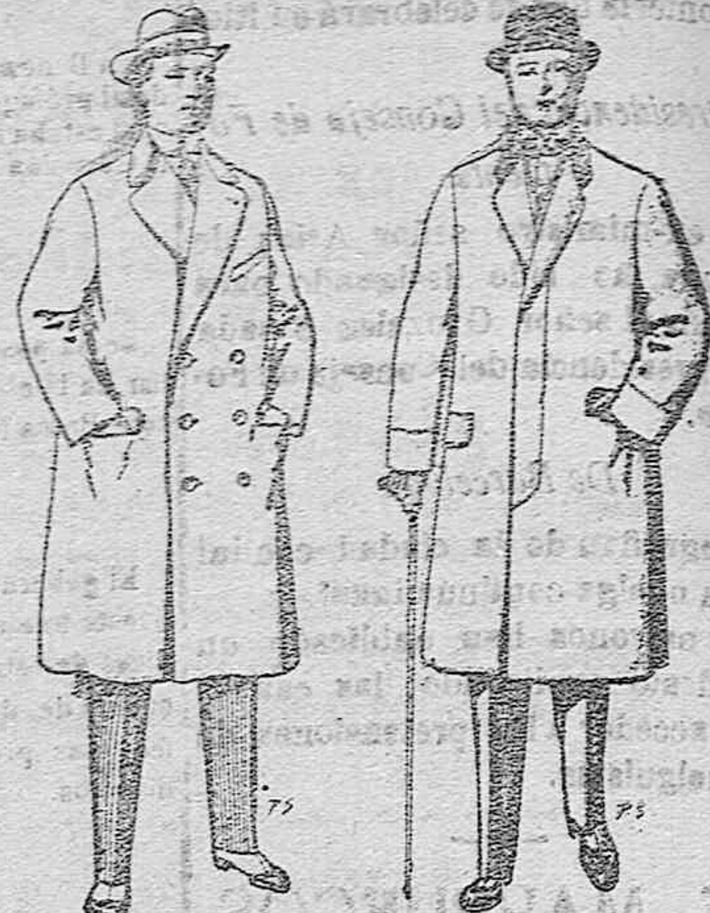
Gabanes de patén cheviot etc. De pesetas 55 á 105 Gabanes de patén, mel-ton y cheviot. De pesetas 25 á 100