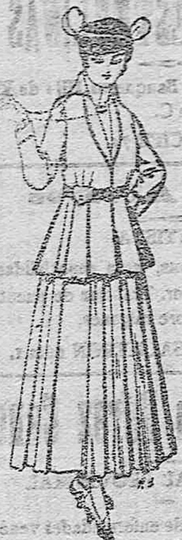
Trajes de lana negra, azul y de color, para señora. A pesetas 85,