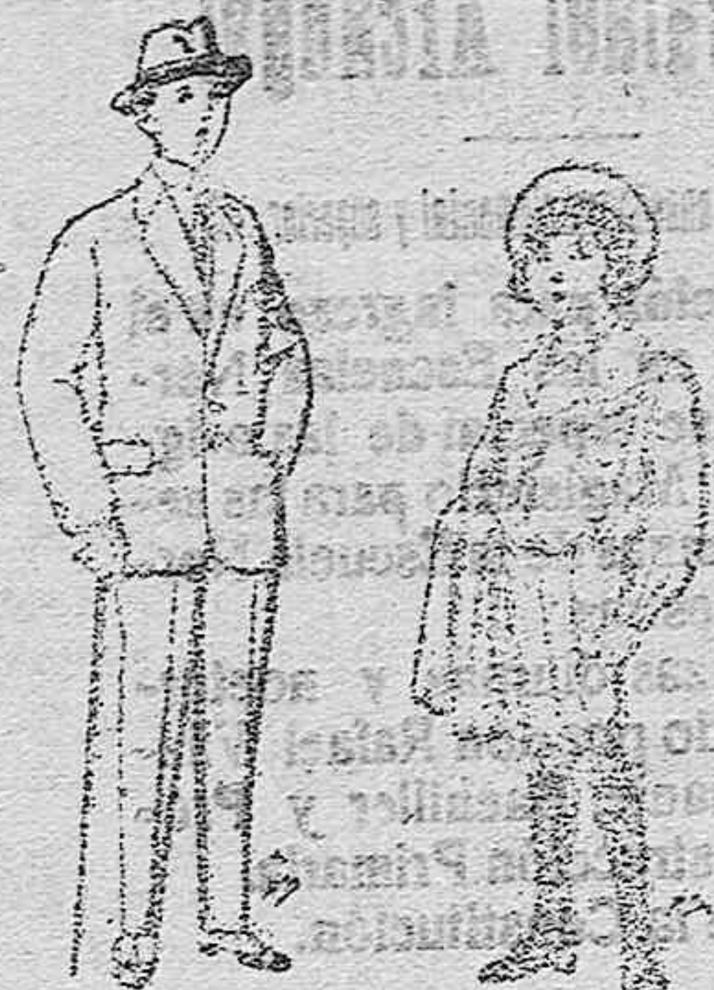
Trajes de patén vicuña ó jerga para niños de 10 á 12 años. De pts. 14 á 50 Trajes de jerga negra ó azul para niños de 4 á 9 años. De pts. 5 á 10