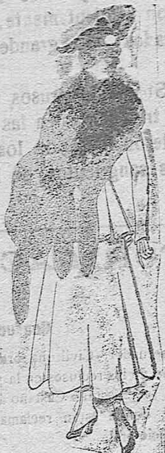
Juego de pieles imitación perfecta al renar-negro. De pts. 40 á 4d