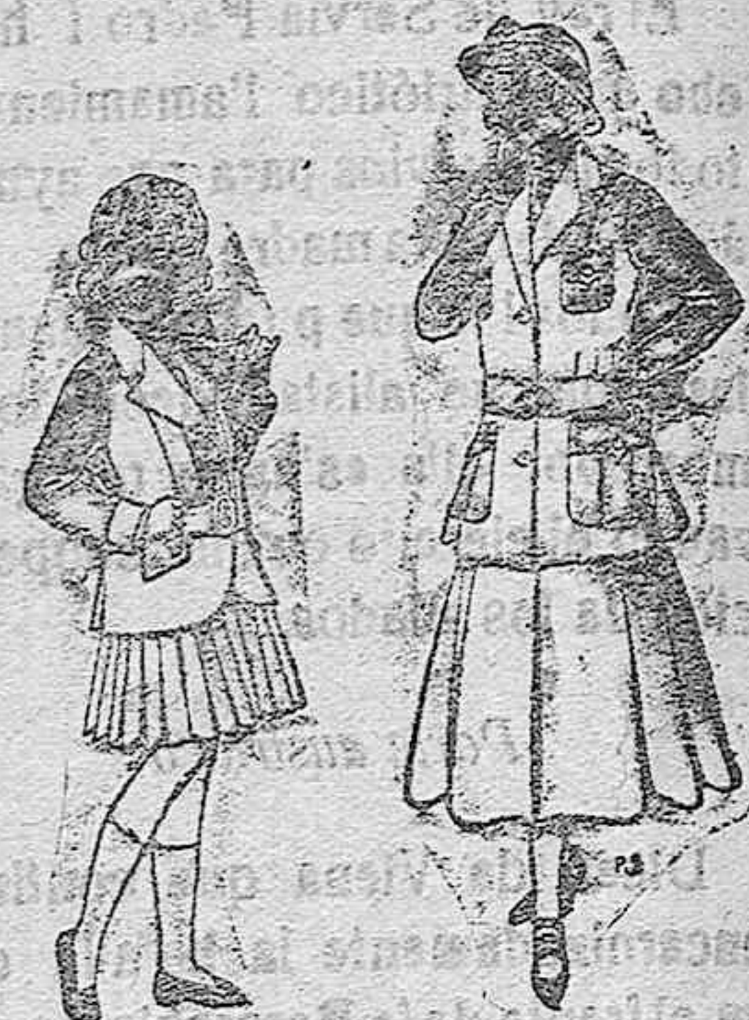
Trajes de lana para niñas de 4 á 12 años. De pesetas 20 á 35 Trajes de lana para jovencitas de 13 á 16 años. De pesetas 40 á 45.