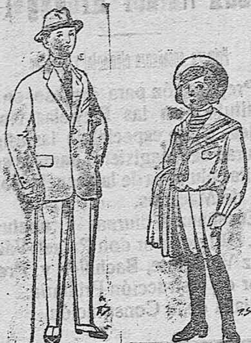
Trajes de patén vicuña ó jerga para niños de 10 á 16 años. De ptas. 14 á 50 Trajes de jergal negra ó azul para niños de 4 á 9 años. De pts. 5 á 10.