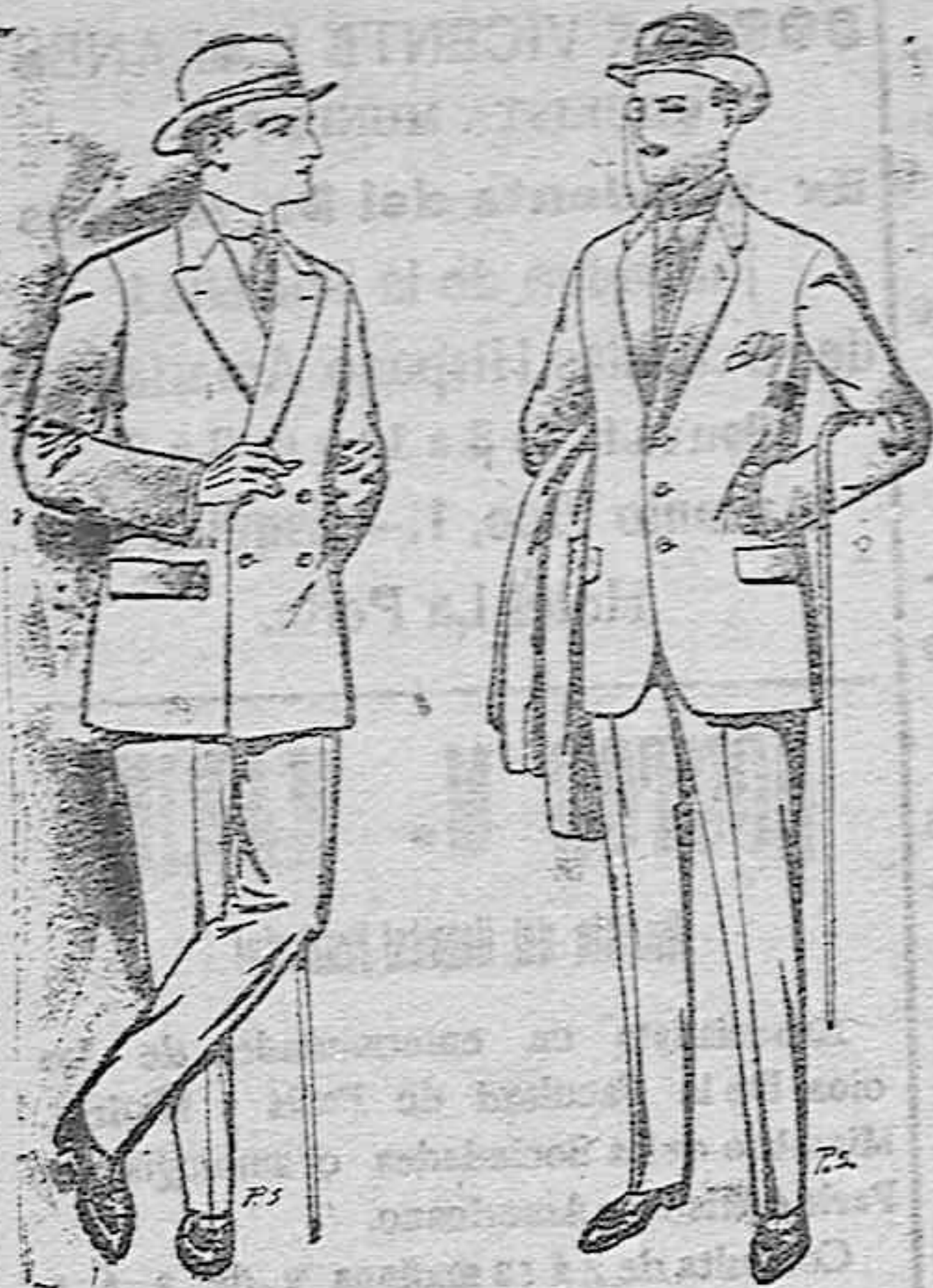
Trajes de cheviot patén, etc. De pesetas 27 á 85 Trajes de patén cheviot etcétera. De pesetas 17'50 á 80