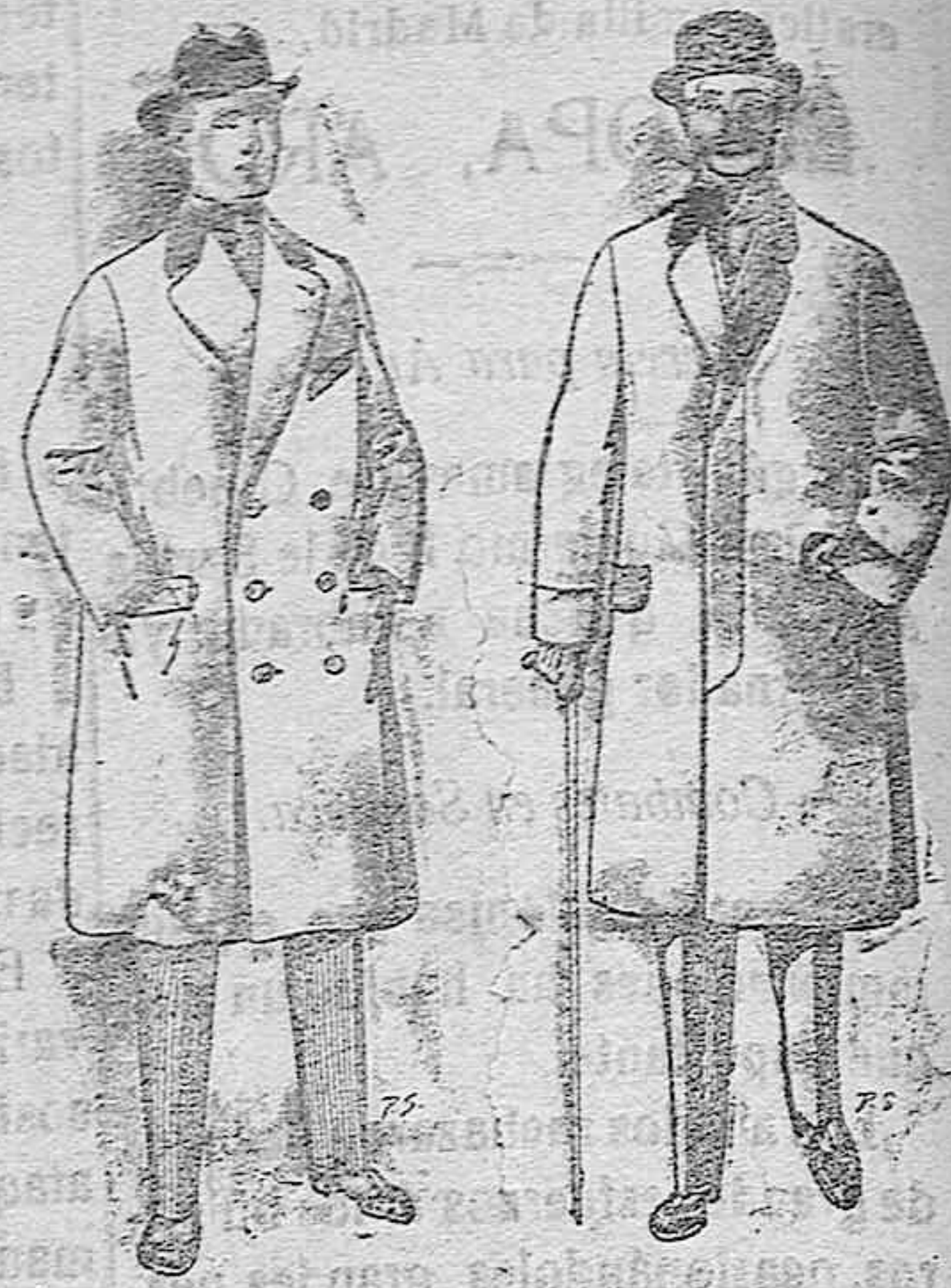
Gabanes de patén cheviot etc. De pesetas 55 á 105 Gabanes de patén, melton y cheviot. De pesetas 25 á 100