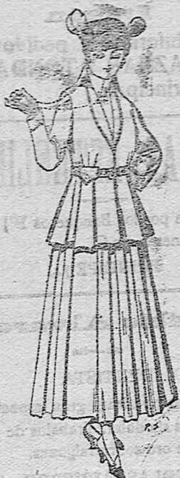
Trajes de lana negra, azul y de color, para señora. A pesetas 85,