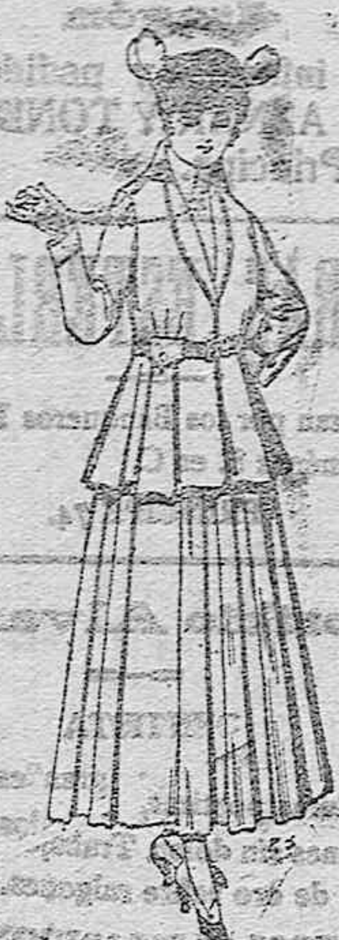
Trajes de lana negra, azul y de color, para señora. A pesetas 85.