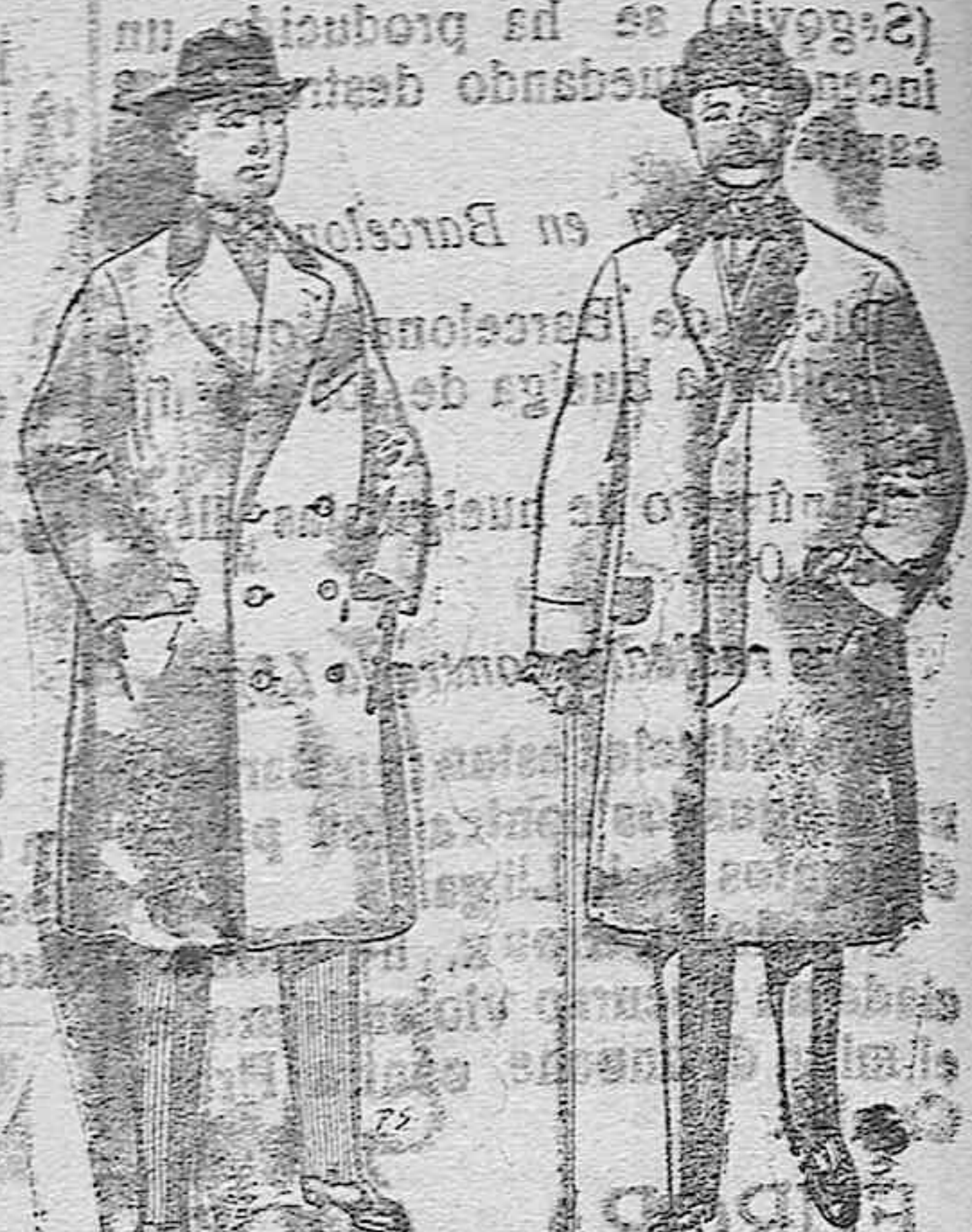
Gabanes de patén cheviot etc. De pesetas 55 á 105 Gabanes de patén, melton y cheviot. De pesetas 25 á 100