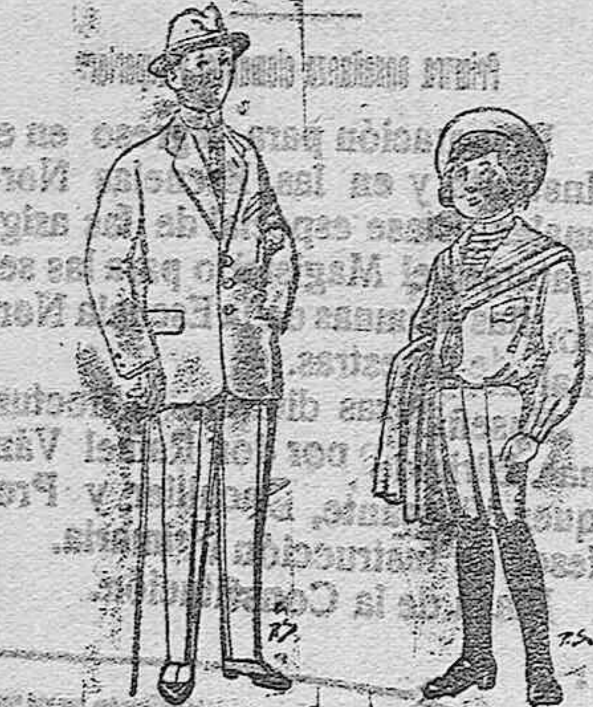
Trajes de patén vicuña ó jerga para niños de 10 á 16 años. De ptas. 14 á 50 Trajes de jergal negro ó azul para niños de 4 á 9 años. De ptas. 5 á 10.