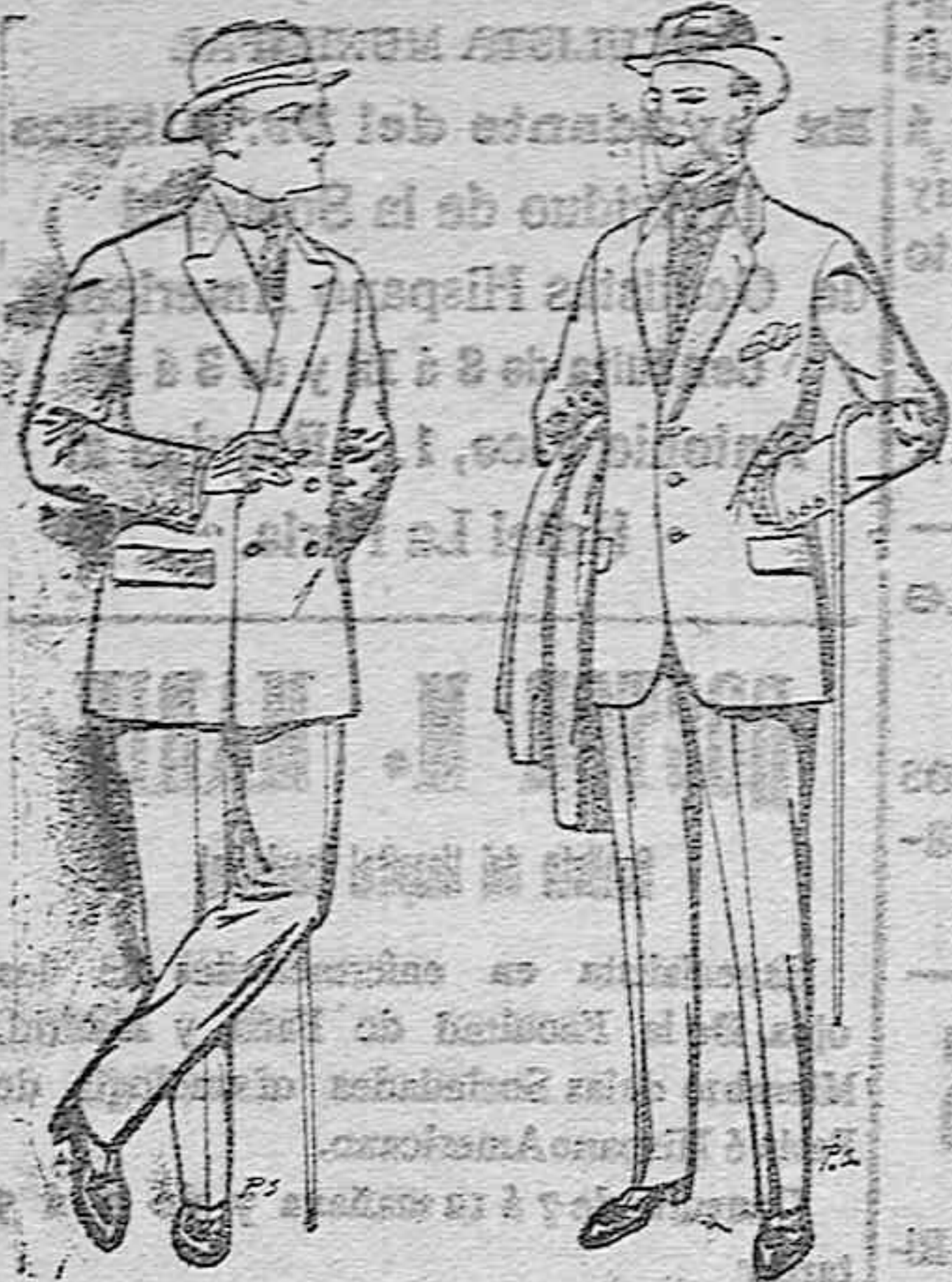
Trajes de cheviot patén, etc. De pesetas 27 á 85 Trajes de patén cheviot etcétera. De pesetas 17'50 á 80