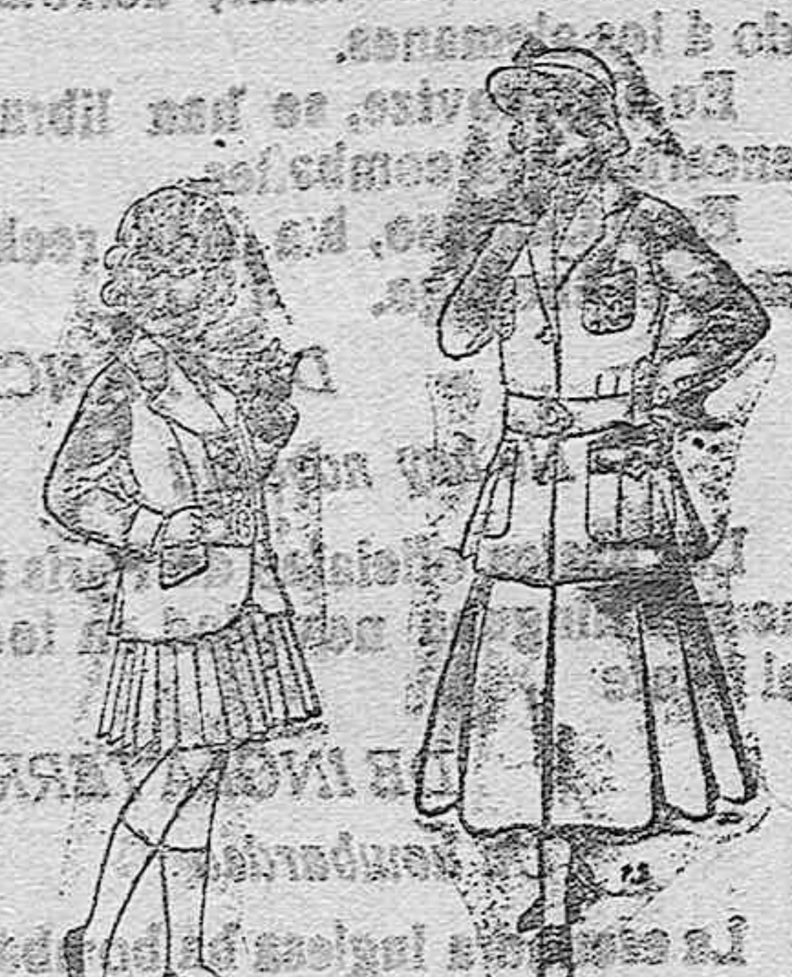
Trajes de lana para niñas de 4 á 12 años. De pesetas 20 á 35 Trajes de lana para jovencitas de 13 á 16 años. De pesetas 20 á 45