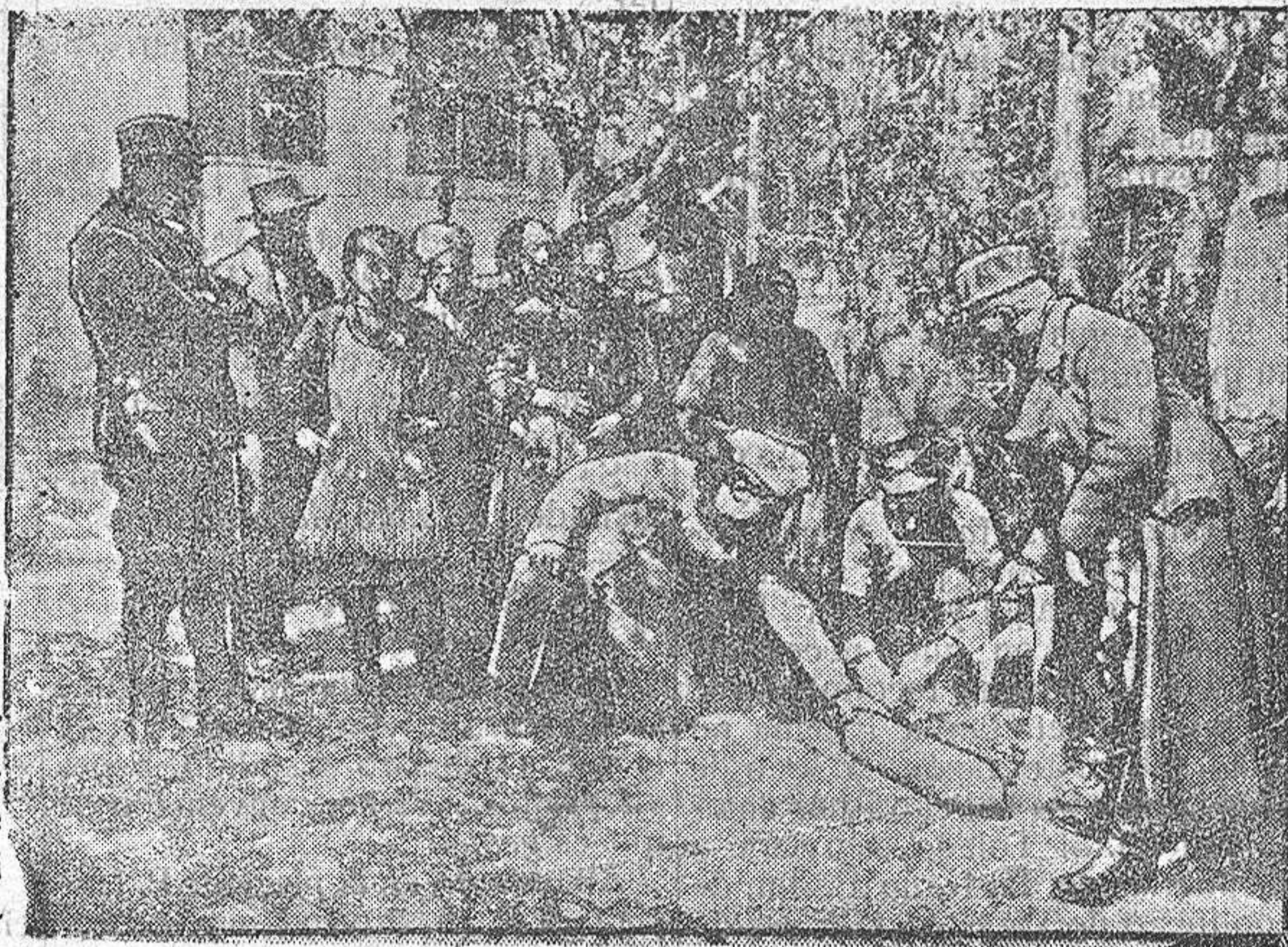
MUJERES Y NIÑOS DE MONASTIR EXAMINANDO UN OBÚS BÚLGARO

Los idóneos han perdido la calma. Desde ayer andan a saltos buscando un árbol que les dé sombra. ¿Quién será el alcalde? ¿Quién será el jefe? Nadie lo sabe; más no deben ignorar que el que a mal árbol se arrima, mala sombra le cobija; y aquí hay sombras malditas.