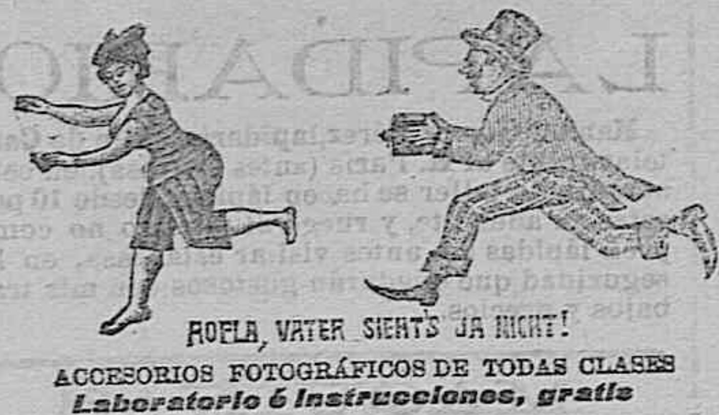
POELA WATER SIERTS JA NICHT! ACCESORIOS FOTOGRAFICOS DE TODAS CLASES Laboratorio e Instrucciones, gratis