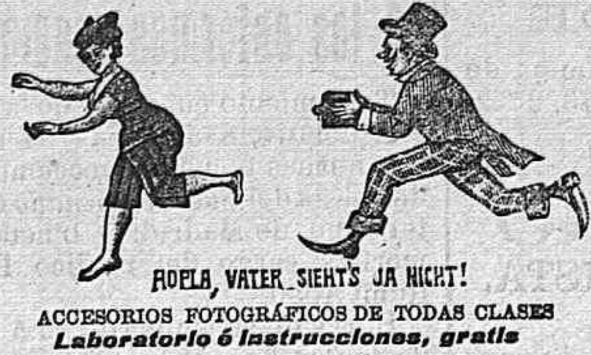
ROELA, WATER, SIENYS JA NICHT! ACCESORIOS FOTOGRAFICOS DE TODAS CLASES Laboratorio & Instrucciones, gratis