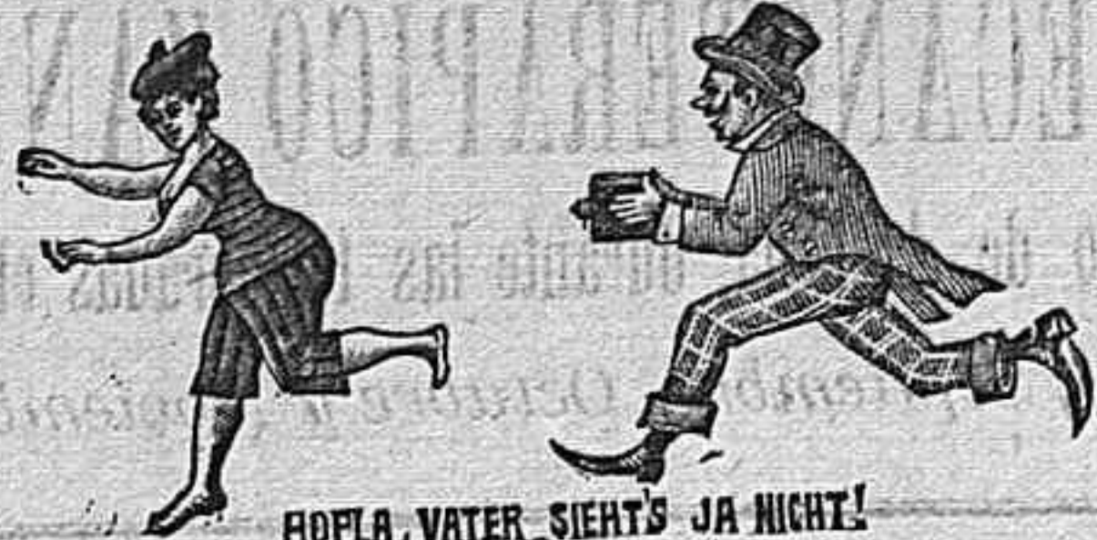
POELA, WATER SIETS JA NICH! ACCESORIOS FOTOGRAFICOS DE TODAS CLASES Laboratorio e Instrucciones, gratis