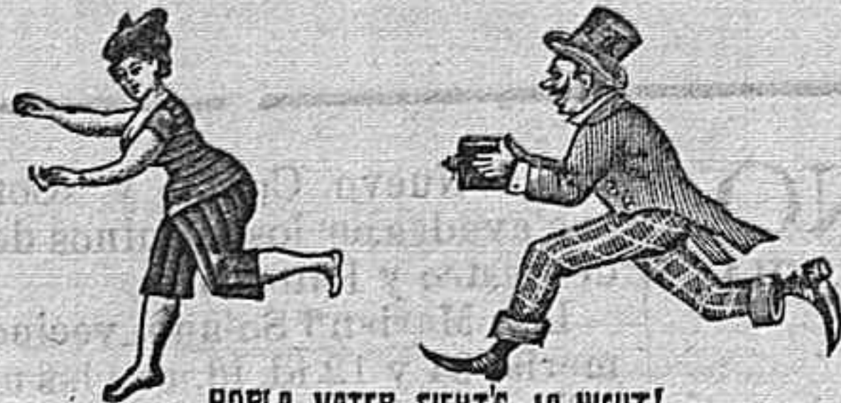
ROELA, WATER, SIHTS JA NICHT! ACCESORIOS FOTOGRAFICOS DE TODAS CLASES Laboratorio é instrucciones, gratis

EUGENIO DE BUSTOS CÁMARAS FOTOGRAFICAS PROPIAS PARA REGALOS Gran surtido á precios baratos CALLE DE GRANADA NÚM. 25, TELÉFONO 74.