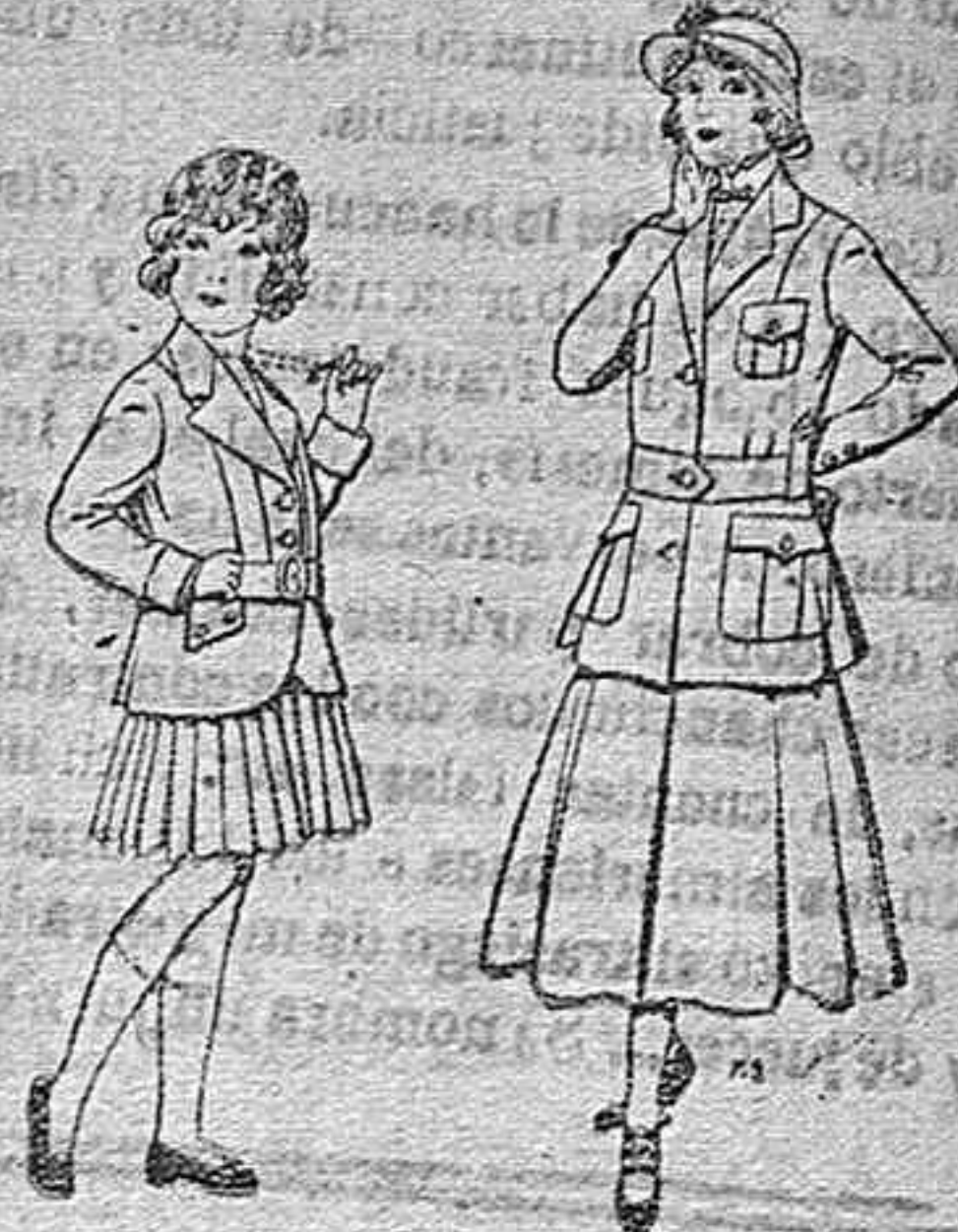
Trajes de lani-lla para niñas de 4 á 12 años. De pesetas 20 á 35 Trajes de lana para jovencitas de 13 á 16 años. De pesetas 40 á 45.