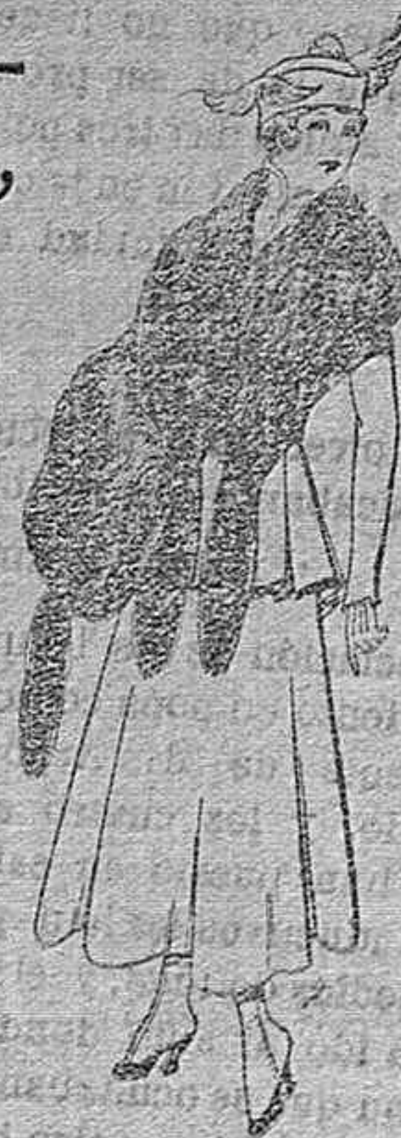
Juego de pieles imitación perfecta al renard negro. De pts. 40 á 45