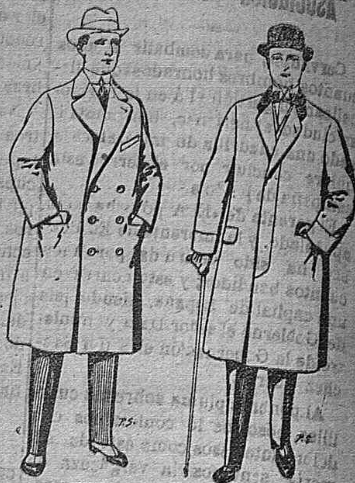
Gabanes de patén cheviot etc. De pesetas 55 á 105 Gabanes de patén, melton y cheviot. De pesetas 25 á 100