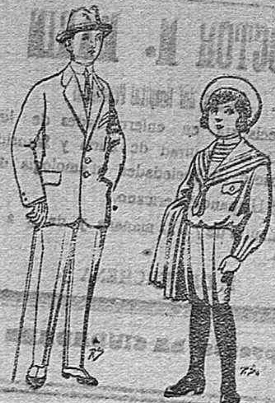
Trajes de patén vicuña ó jerga para niños de 10 á 16 años. De ptas. 14 á 50 Trajes de jerga negra ó azul para niños de 4 á 9 años. De ptas. 5 á 10.