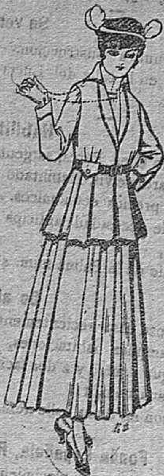
Trajes de lana negra, azul y de color, para señora. A pesetas 85.