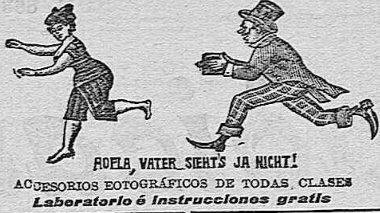
ROELA, WATER, SIERT'S JA NICHT! ACCESORIOS FOTOGRÁFICOS DE TODAS CLASES Laboratorio é Instrucciones gratis

ACEITE PURO de hígado de bacalao y emulsiones de mismo aceite de Scott Nadal y otros doctores Jarabe legítimo del Doctor Pagliano y demás especialidades AGUAS MINERALES NACIONALES Y EXTRANJERAS