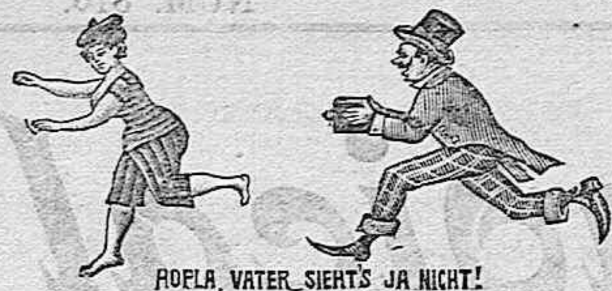
HOPLA, VATER, SIERTS JA NICHT!

Accesorios fotográficos de todas clases Laboratorio e instrucciones gratis